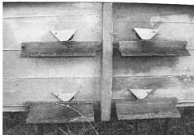
Льотки на зиму прикриваю, залишаю щілину для проходу 1-2 бджіл.