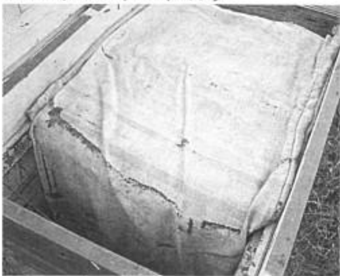
Вільні краї мішків закладаю на гніздо.