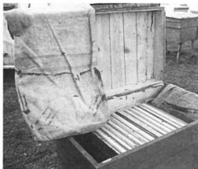
З боків гніздо утеплюю мішками, в яких 2–3 шари картону.