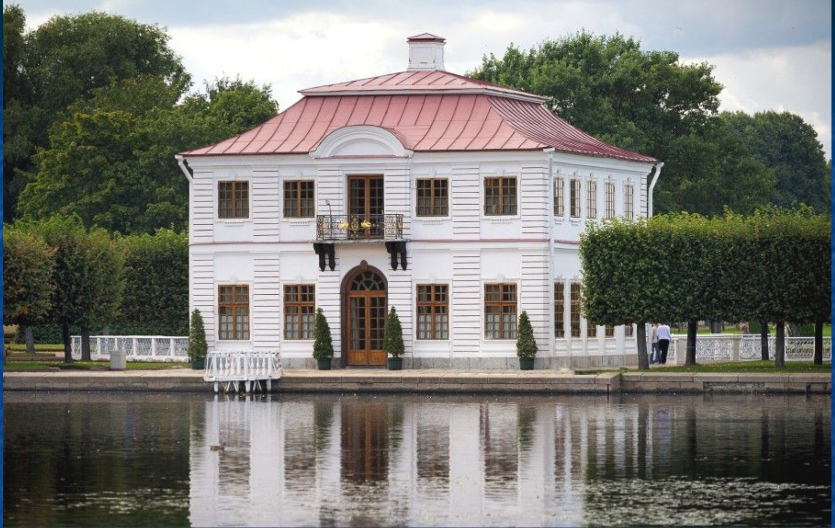
Дворец Марли в Петергофе. Арх. И. Браунштейн