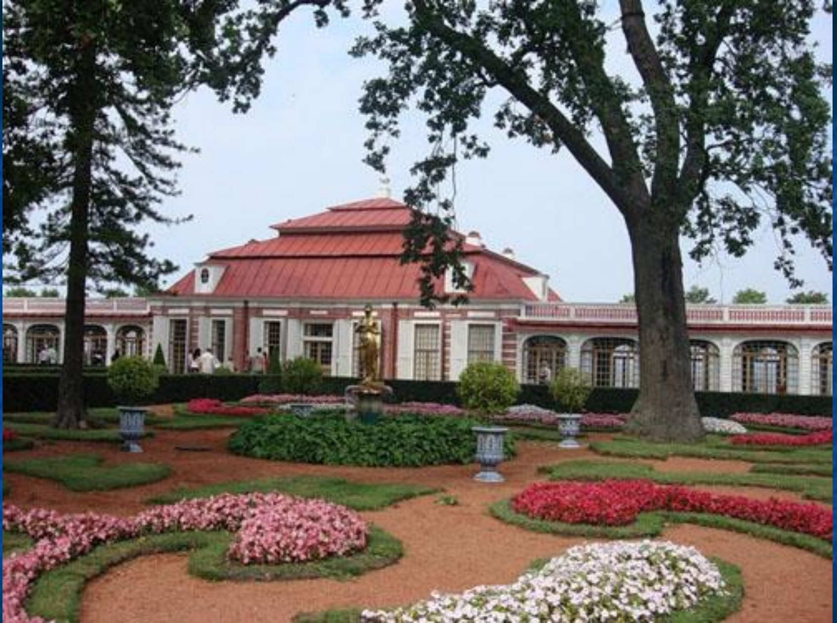
Дворец Монплезир в Петергофе