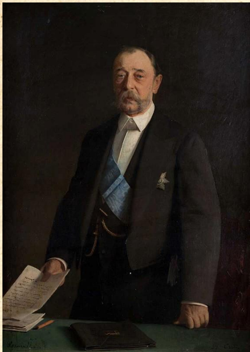
Д.А. Толстой — министр просвещения.