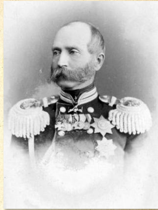
Ф.Ф. Трепов — глава полиции.