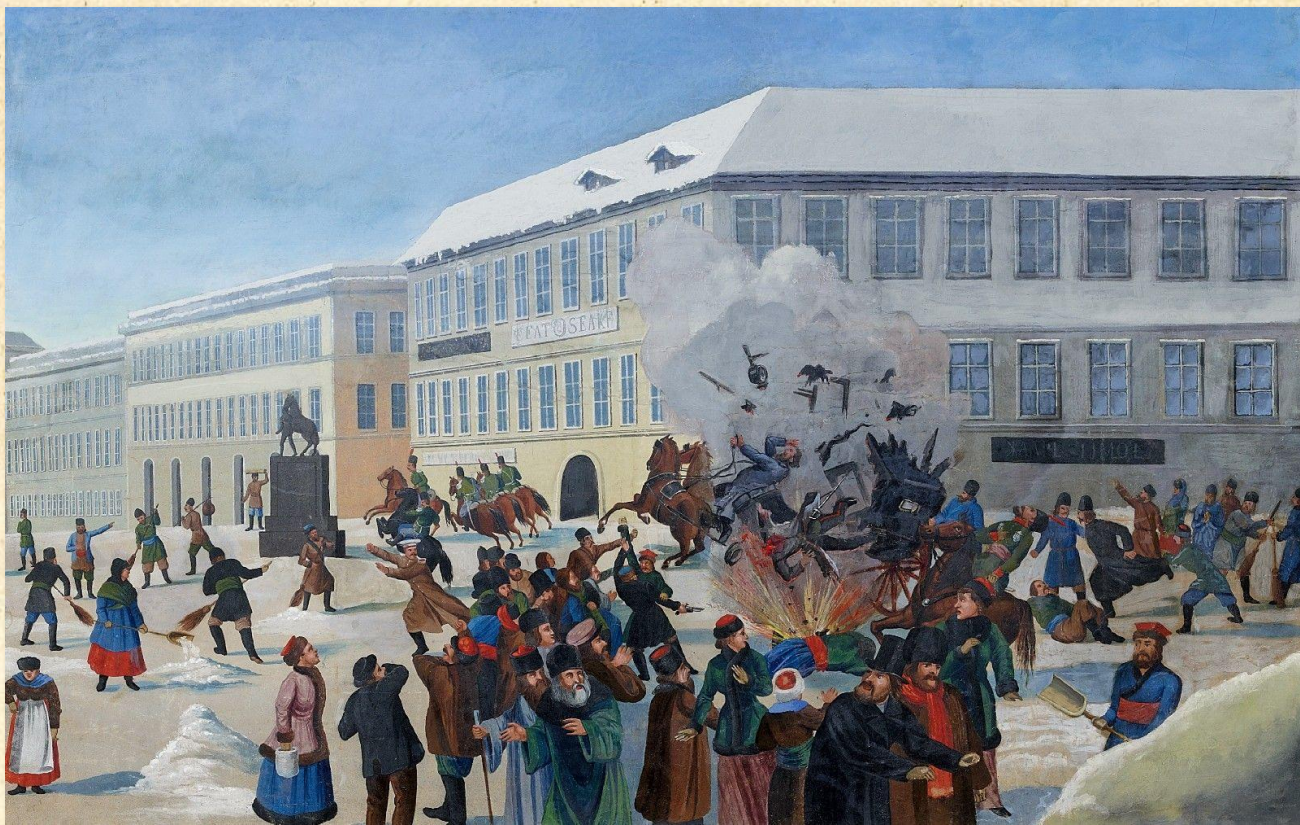
Убийство Александра II