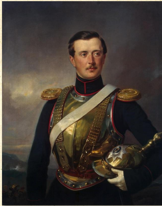
П.А. Шувалов — шеф жандармов.