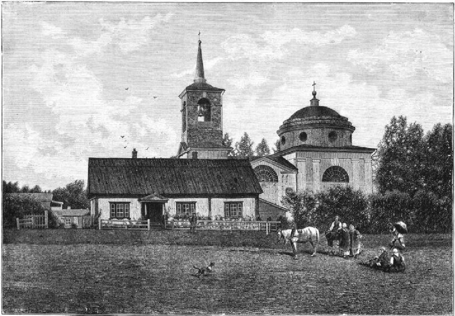
Церковь и устроенная И. С. Тургеневым школа въ с. Спасскомъ. Съ фотогр. Каррика, грав. М. Рашевской.

Церковь и устроенная И. С. Тургеневым школа в Спасском. С фотогр. Каррика, грав. М. Рашевской Рис. из журнала «Нива» (1883, № 42)