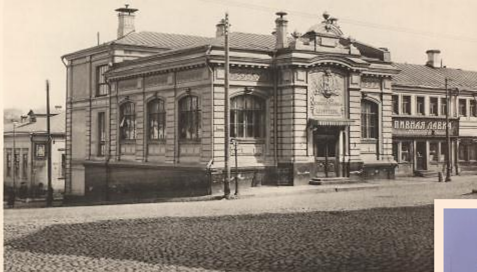
Бесплатная читальня имени И. С. Тургенева. Библиотечное здание Тургенева