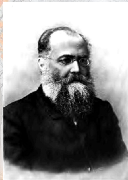
Германъ Александровичъ ЛОПАТИНЪ.