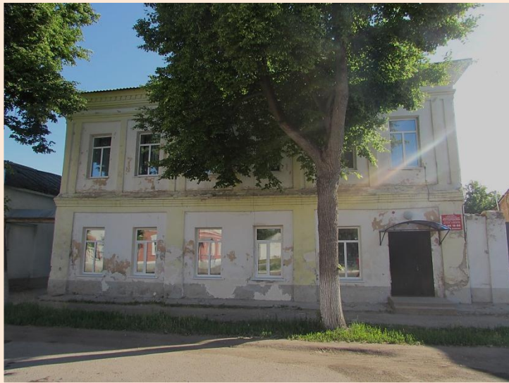
Здания библиотеки им. И.С. Тургенева