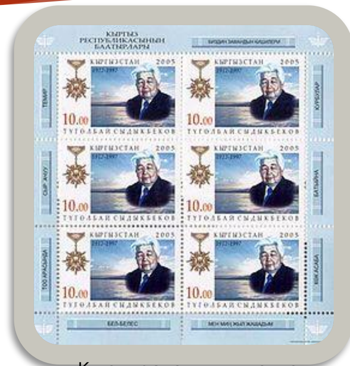
Кыргызстандын почта маркасы, 2005-жыл