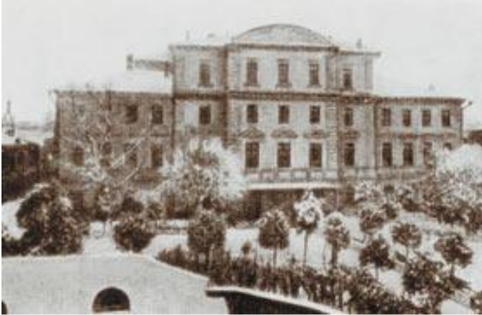
1-ая Московская гимназия