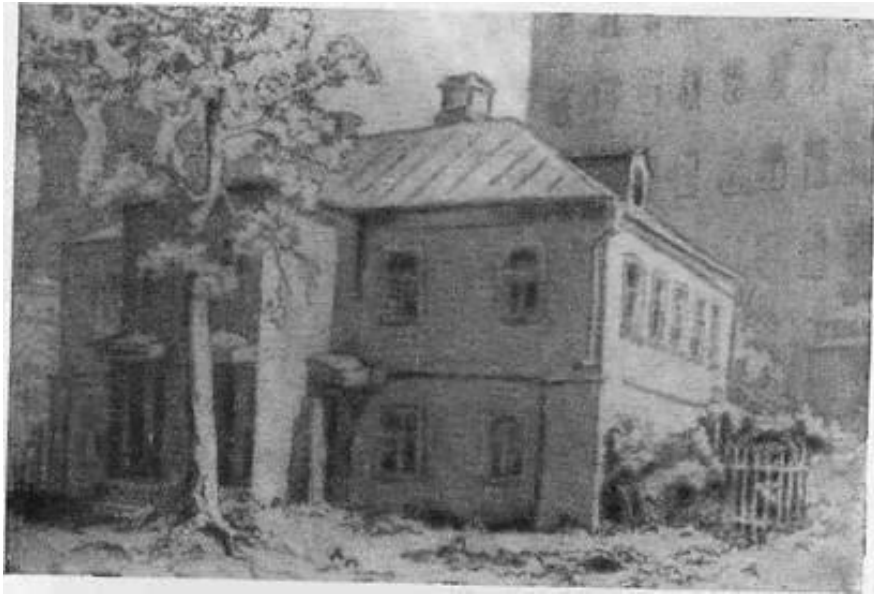
Дом в Голицыновском переулке, где родился А.Н.Островский и дом на Житной улице, где прошло его детство

Островский родился 12 апреля 1823 года и вырос в Замоскворечье - так называлась часть города за Москвой-рекой, где издавна селилось купечество и всякий «простой люд»: приказчики, ремесленники, мелкие чиновники.