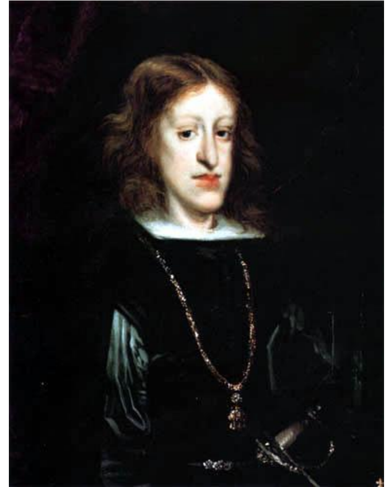
Карл II, последний Габсбург на испанском троне