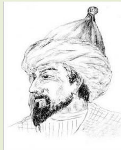
Бұрындық хан 1480-1511