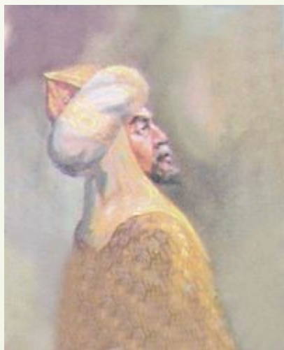
Керей хан 1456 — 1473