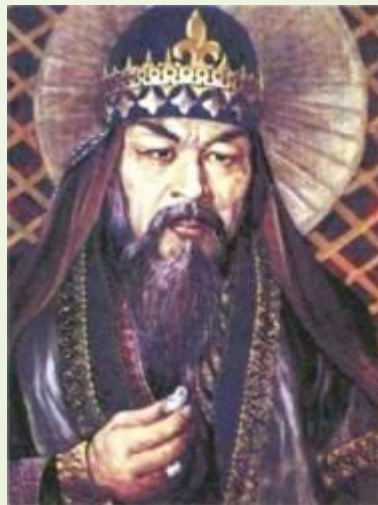
Әз-Жәнібек хан 1473-1480