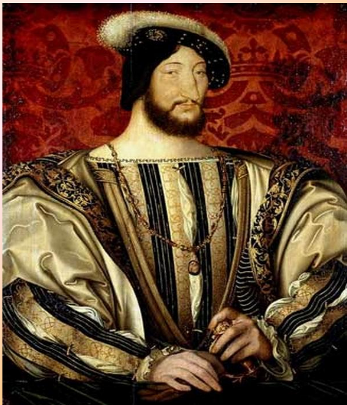
Франциск I Валуа (1515 – 1547)