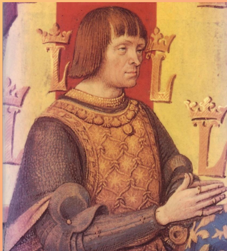
Генрих II Валуа (1547 – 1559)