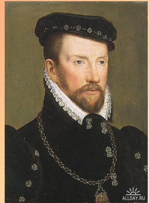
Адмирал Гаспар де Колigny