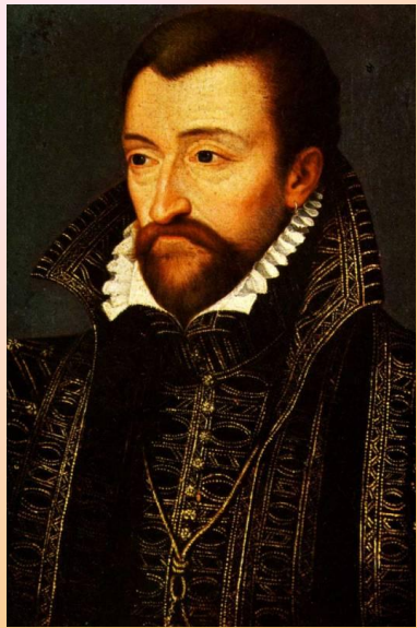
Генрих де Бурбон (Наваррский)