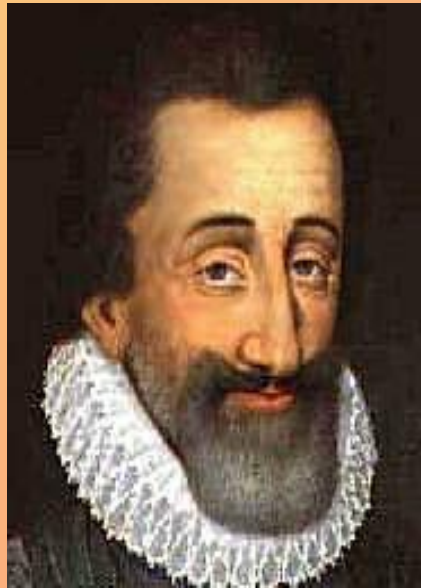
Король Наварры (граница с Испанией) Антуан де Бурбон