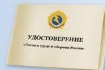
UD6 Размер: 70x100 мм Плотная бумага