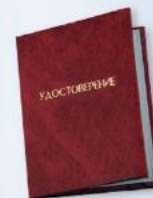
UD4 Размер: 110x80 мм Бумвинил, плотная бумага

ФУТЛЯРЫ ДЛЯ ЗНАКОВ «ГОТОВ К ТРУДУ И ОБОРОНЕ»