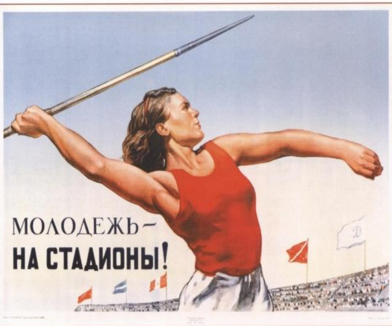
504. Голованов Л. Молодежь — на стадионы! 1947

С 2010 года программа начала свое возрождени.