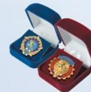
FU125a (бордо) FU125b (синий) Внут. размер: 45x42 мм

ПОДЛОЖКА В УПАКОВКЕ ДЛЯ ЗНАКОВ «ГОТОВ К ТРУДУ И ОБОРОНЕ»