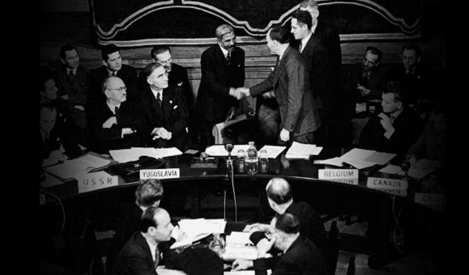
Первая сессия ЭКОСОС 1946 год