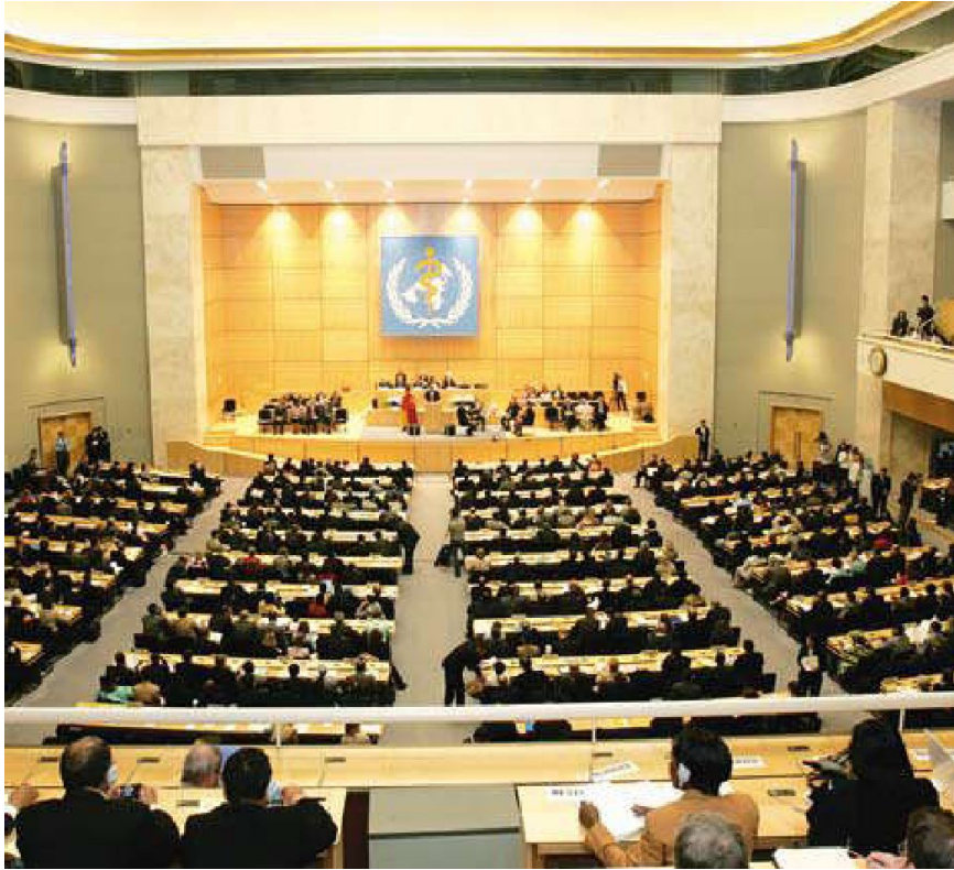
Всемирная Ассамблея здравоохранения

Всемирная ассамблея здравоохранения является высшим органом ВОЗ.