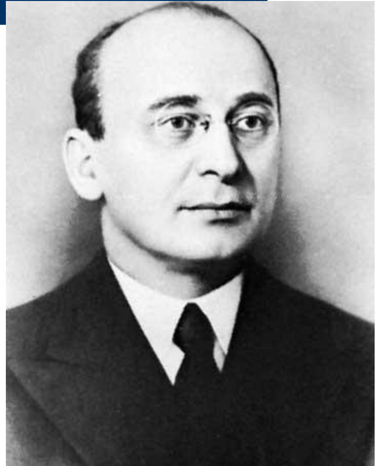
Лаврентий Берия Глава МВД