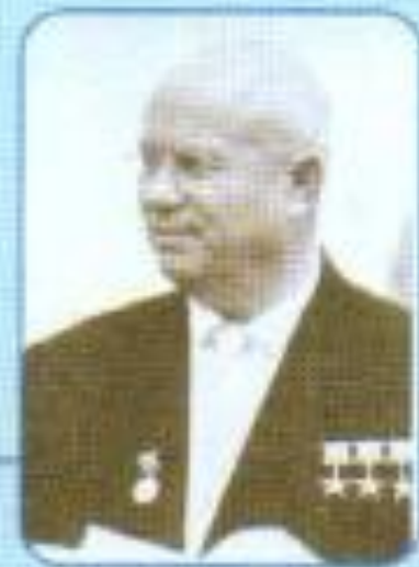
Хрущёв Никита Сергеевич 1894–1971

Н.С.ХРУЩЕВ одержал полную победу и сосредоточил в своих руках партийную и государственную власть в СССР.