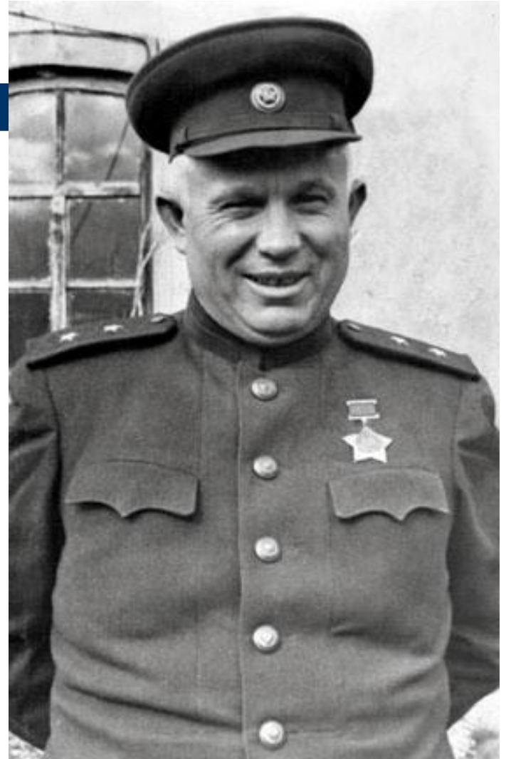
Никита Сергеевич Хрущев Секретарь ЦК КПСС