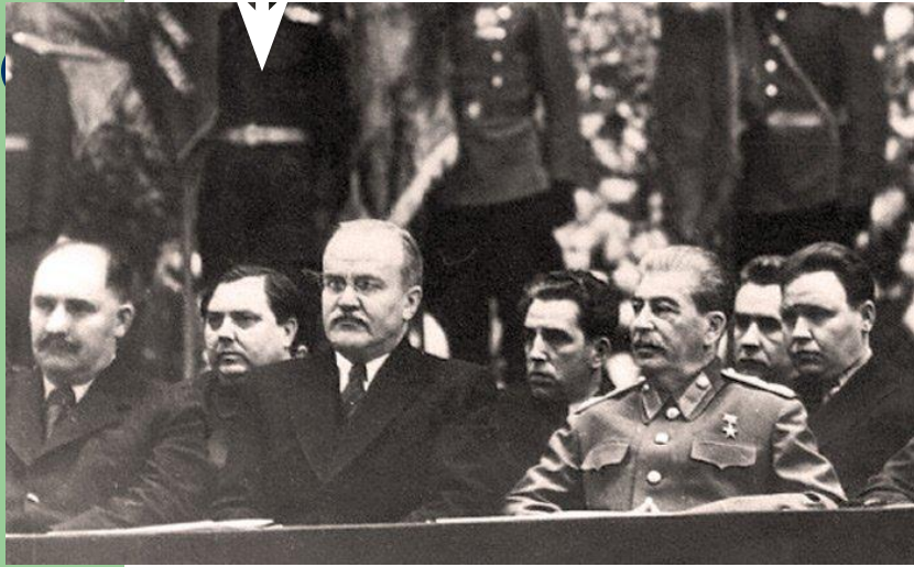
Георгий Маленков Председатель Совета министров