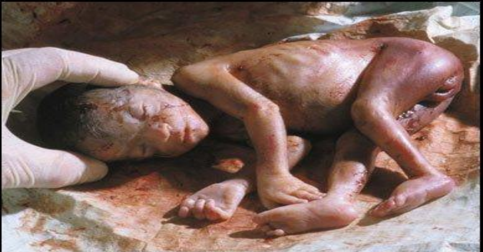
24 Week Aborted Fetus