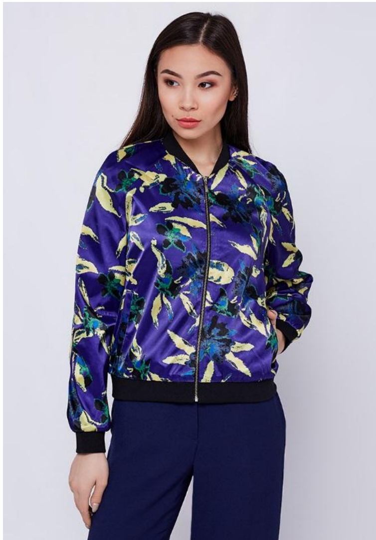
Кроп фронт 1 кадр