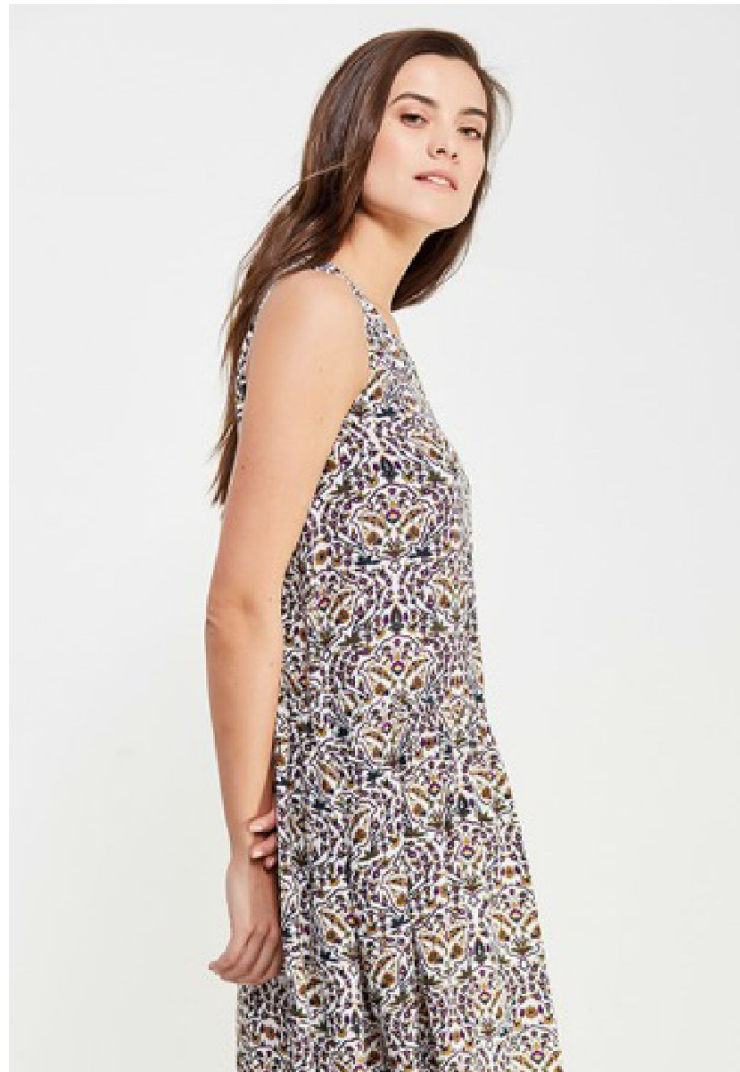
Кроп фронт 2 кадр