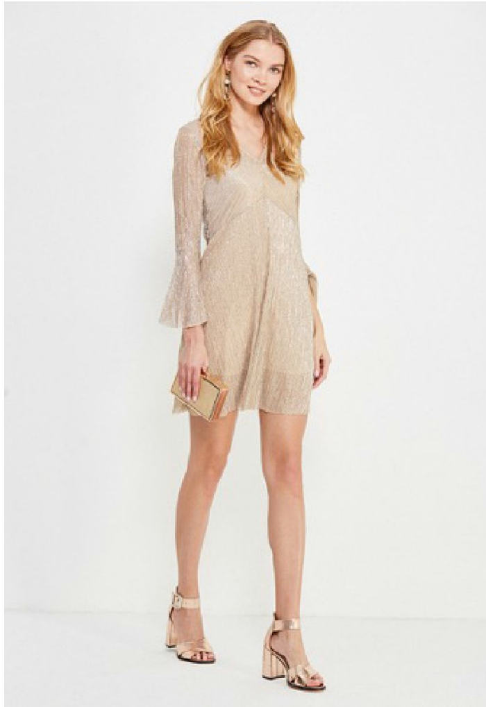
Рост фронт 2 кадр