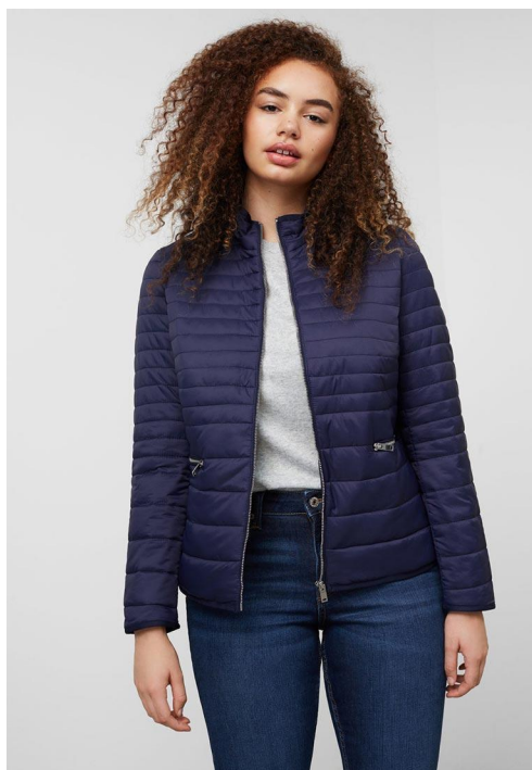
Да. Идеальное позирование