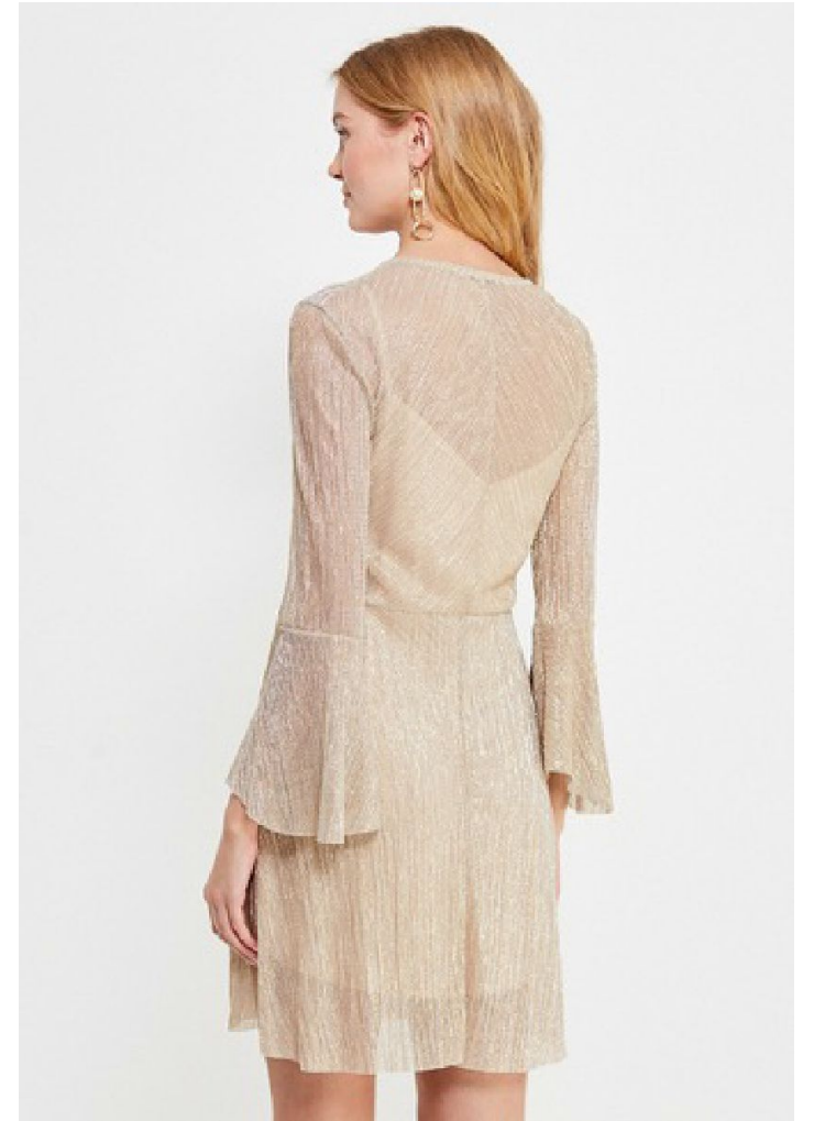
Кроп спина 3 кадр