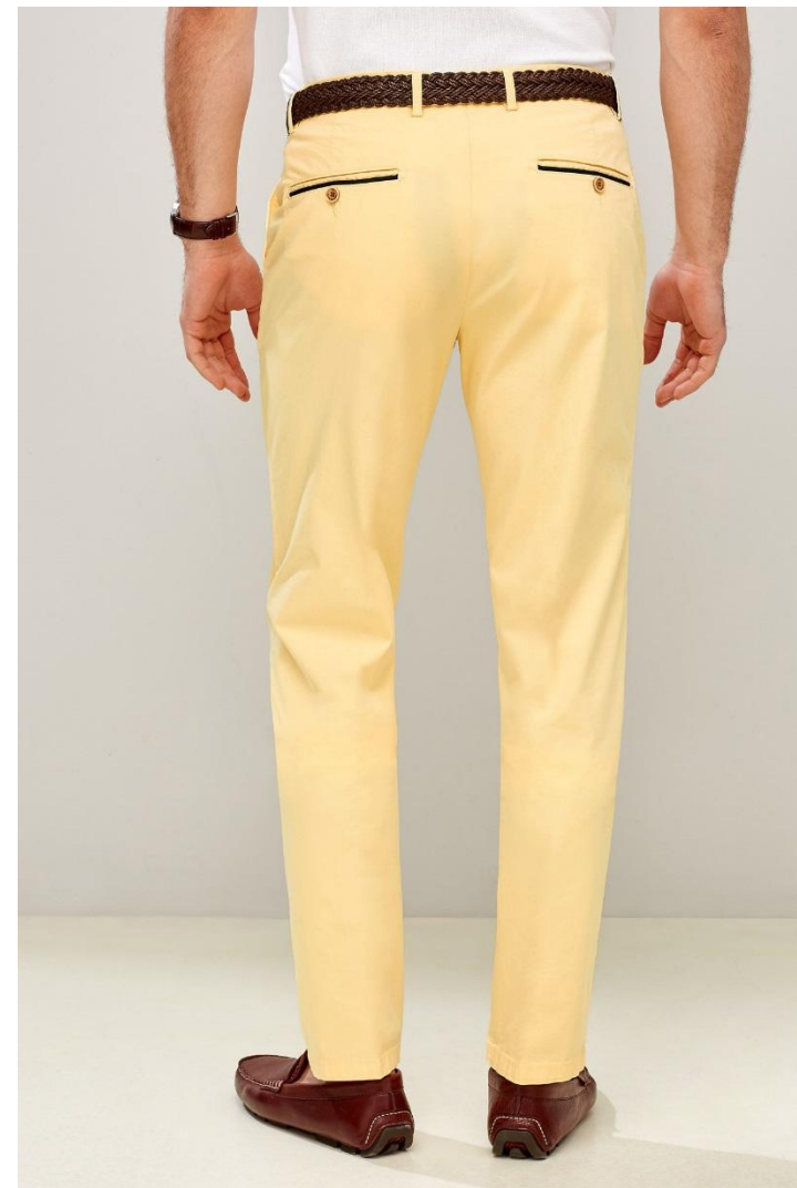
Кроп спина 3 кадр