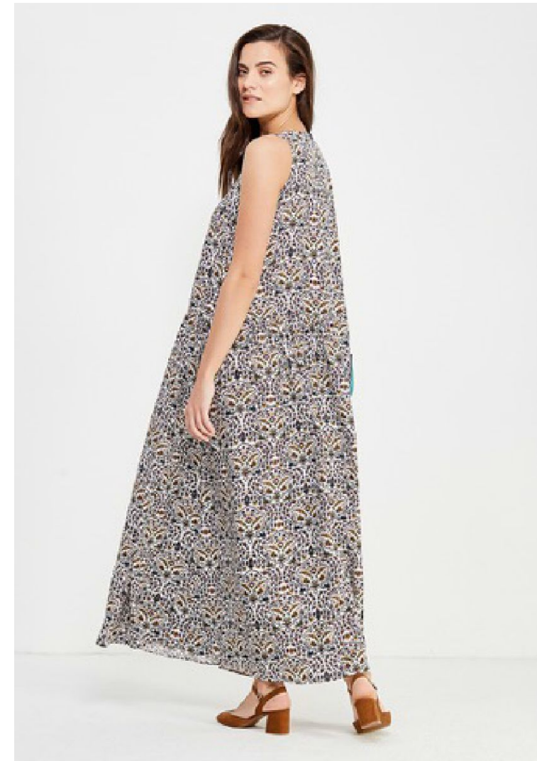
Рост спина 3 кадр