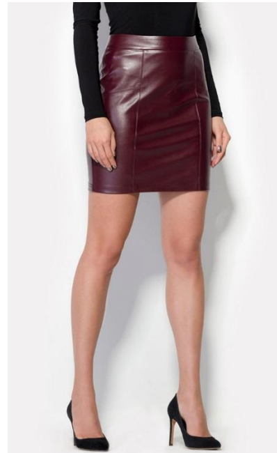
Да. Одежда должна быть заправлена