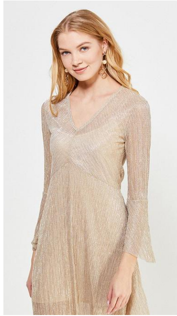
Нет. Изделие в кадре не полностью