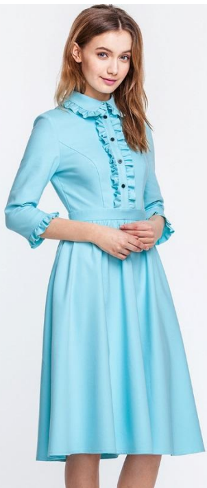
Да. Идеальное позирование

Расслабленное позирование. Не допускаются вычурные и неестественные позы.