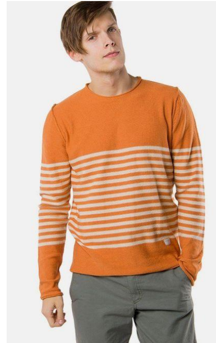
Да. Идеальный фон