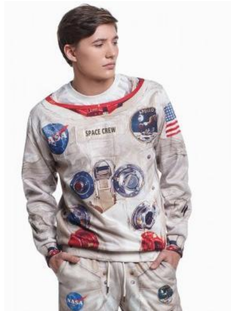
Кроп фронт 2 кадр