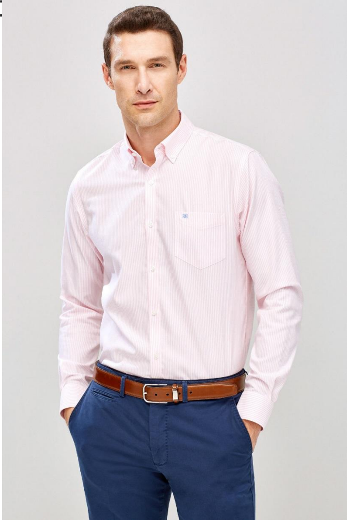
Кроп фронт 1 кадр