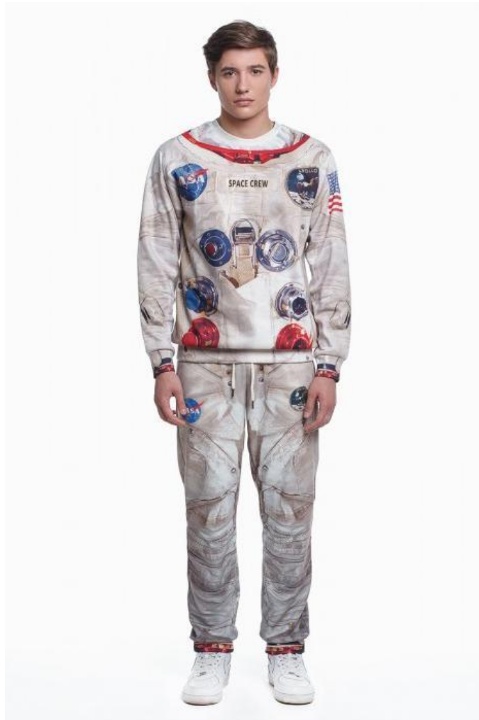
Рост фронт 1 кадр