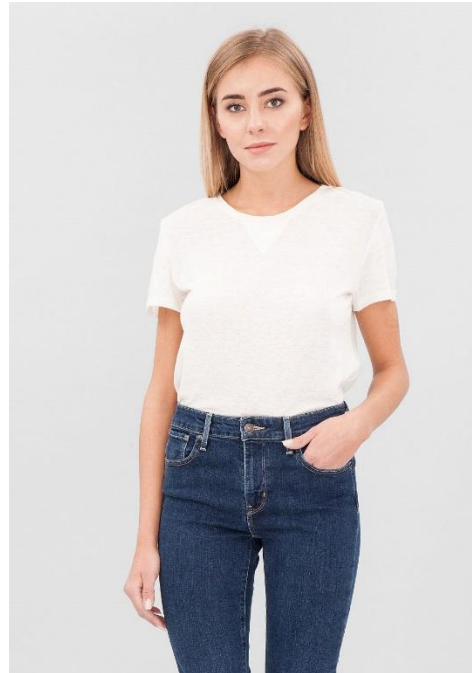
Да. Идеальный фон