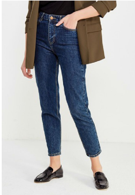
Да. Идеальный фон

Обращайте внимание – пол должен быть чистый без грязи (это видно потом на фото)