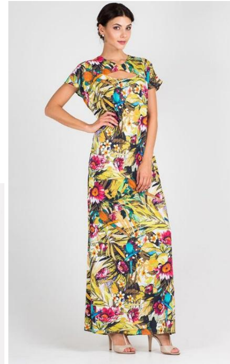
Да. Верное кадрирование