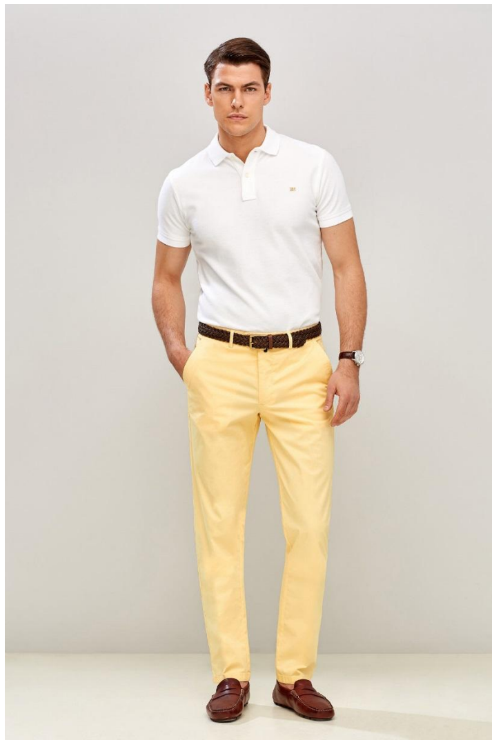
Рост фронт 2 кадр