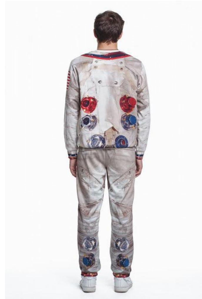
Рост спина 3 кадр