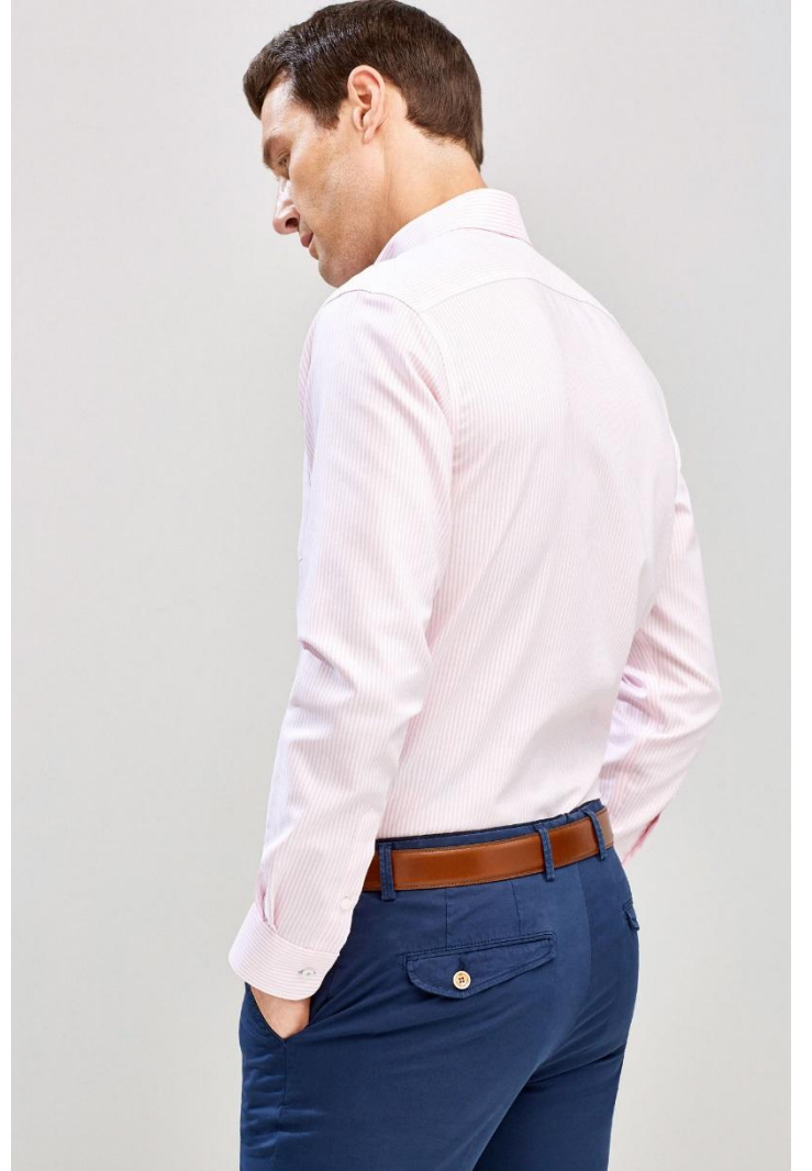
Кроп спина 3 кадр