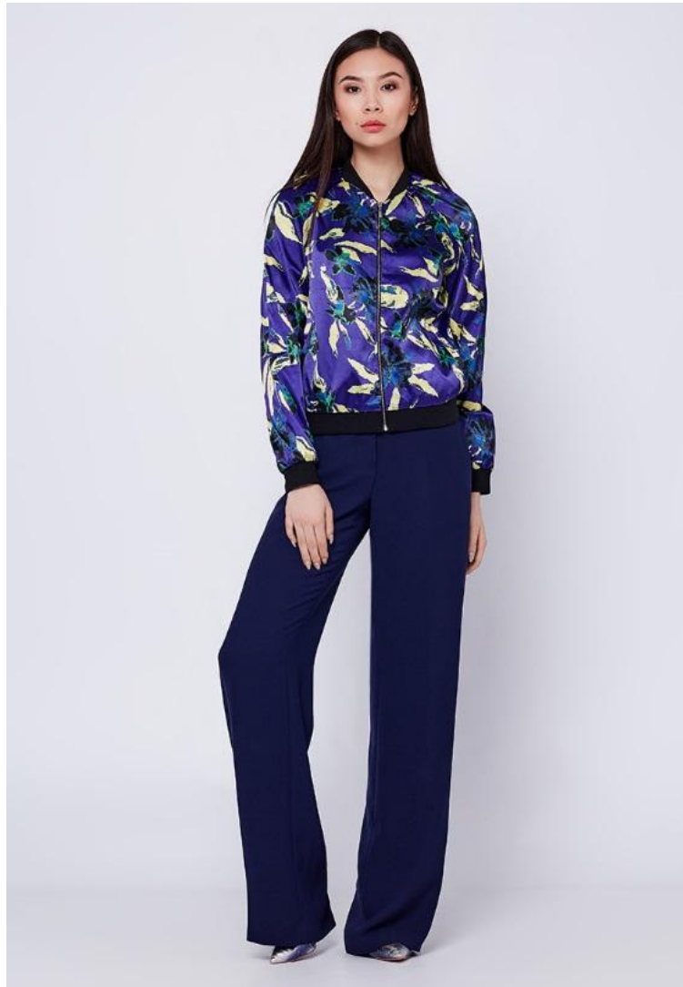
Рост фронт 2 кадр