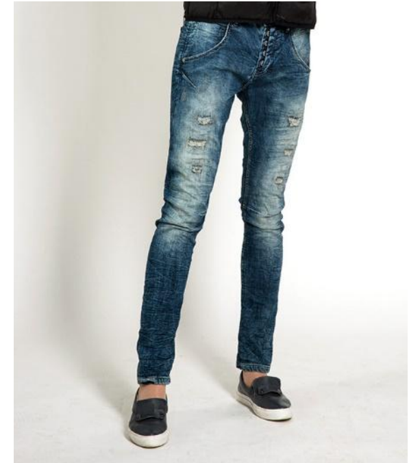
Нет. Грязная обувь и грязный пол