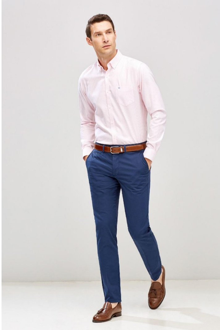
Рост фронт 2 кадр