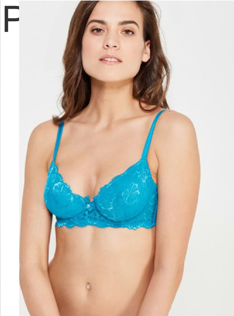
Фронт продукт кадр 2 кадр