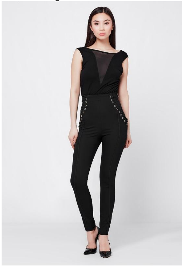
Рост фронт 2 кадр