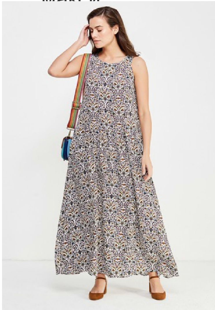
Рост фронт 1 кадр