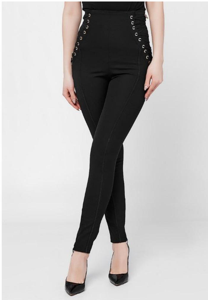
Кроп фронт 1 кадр