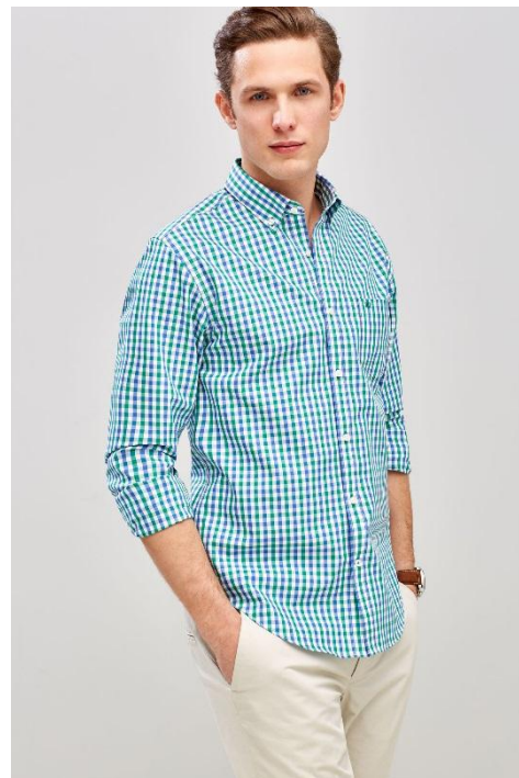
Да. Идеальное позирование