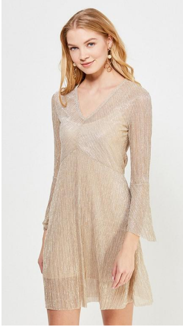
Да. Изделие в кадре полностью