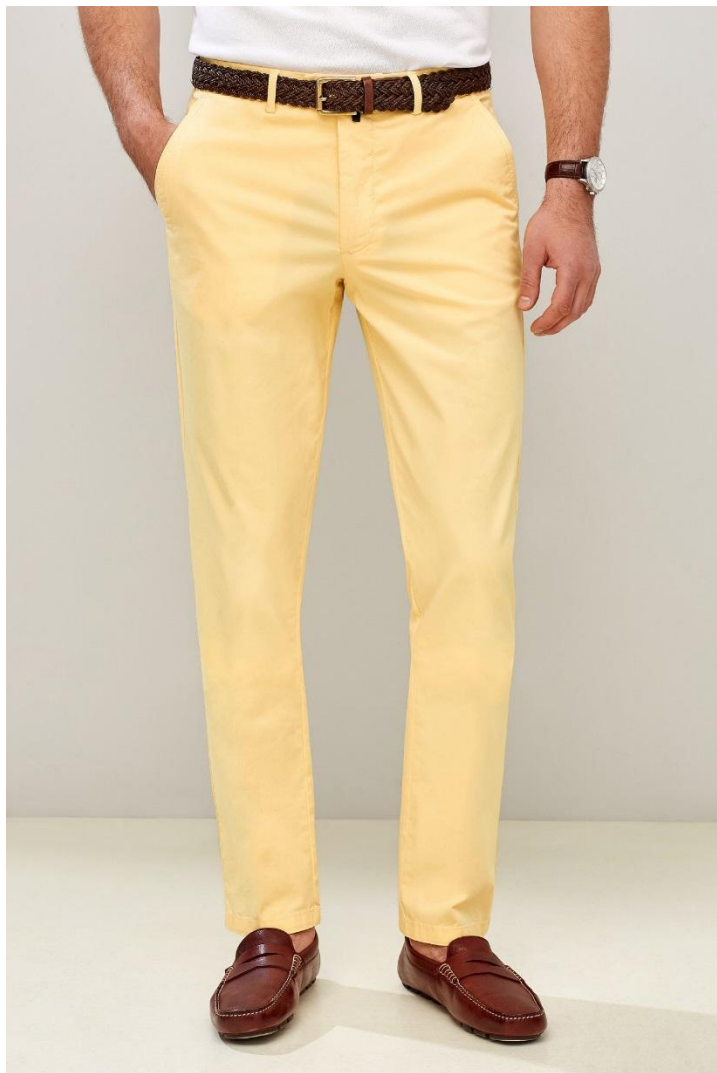
Кроп фронт 1 кадр