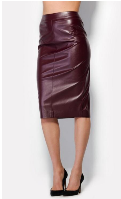
Нет. Не допускается голый живот