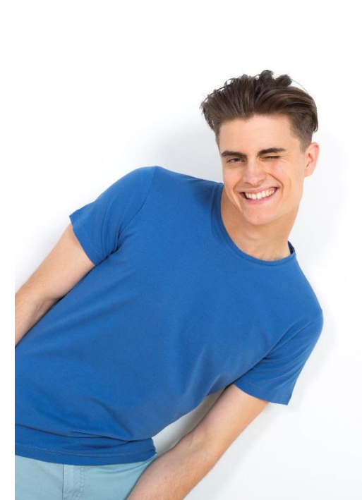
Нет. Неестественное позирование