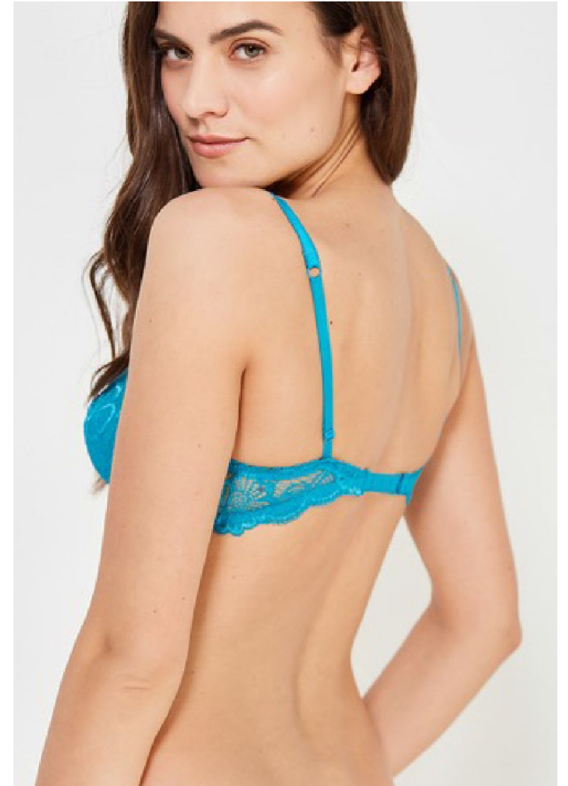
Спина продукт кадр 3 кадр