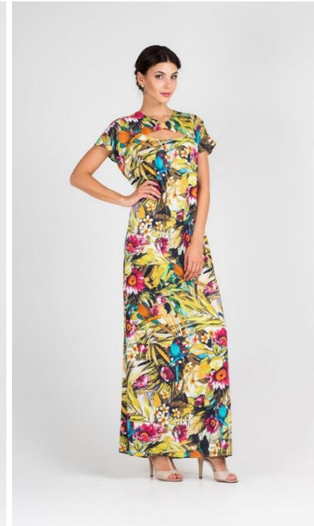
Нет. Большое расстояние сверху и снизу. Модель выглядит мелко