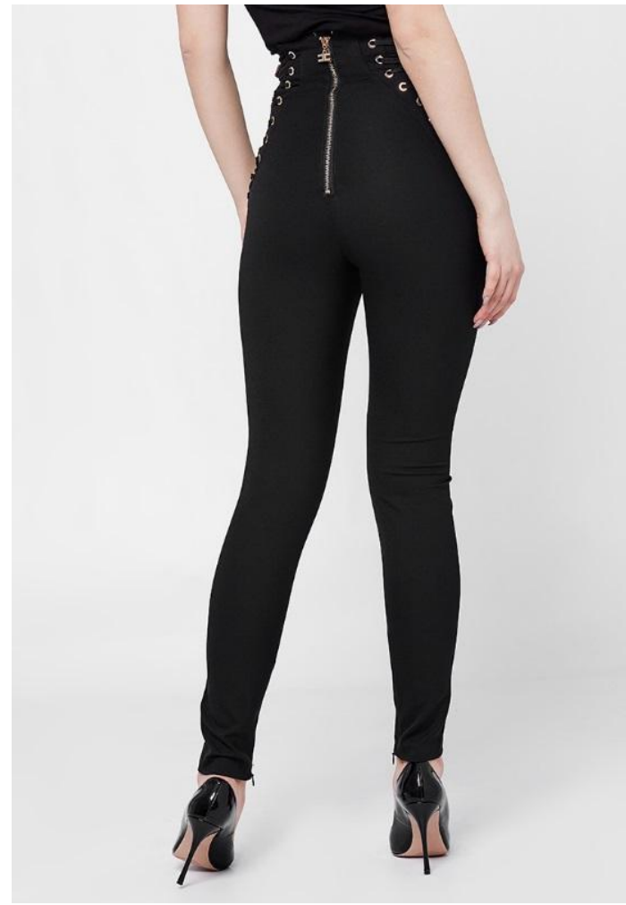
Кроп спина 3 кадр