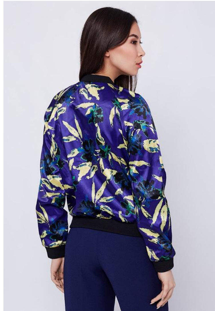
Кроп спина 3 кадр