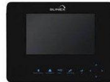
Домофон SLNS MS – 07M