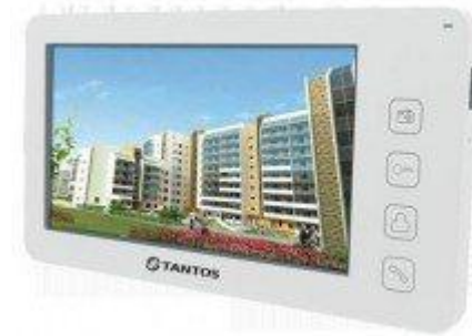
Домофон Tantos Amtlie