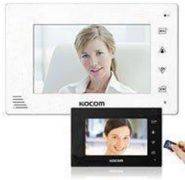
Домофон Kocom KCV-A 3743 звонок