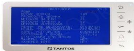
Домофон Tantos Priml