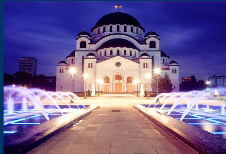
Собор Святого Саввы в Белграде