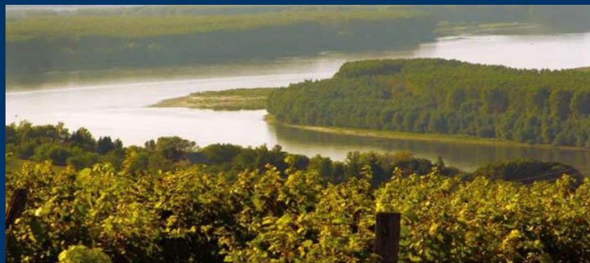
Национальный парк Фрушка - гора