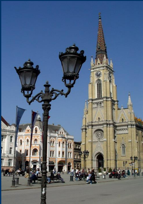
Ратуша в центре города Нови Сад