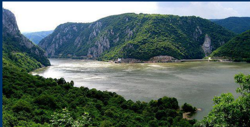
Территория заповедника Джердап