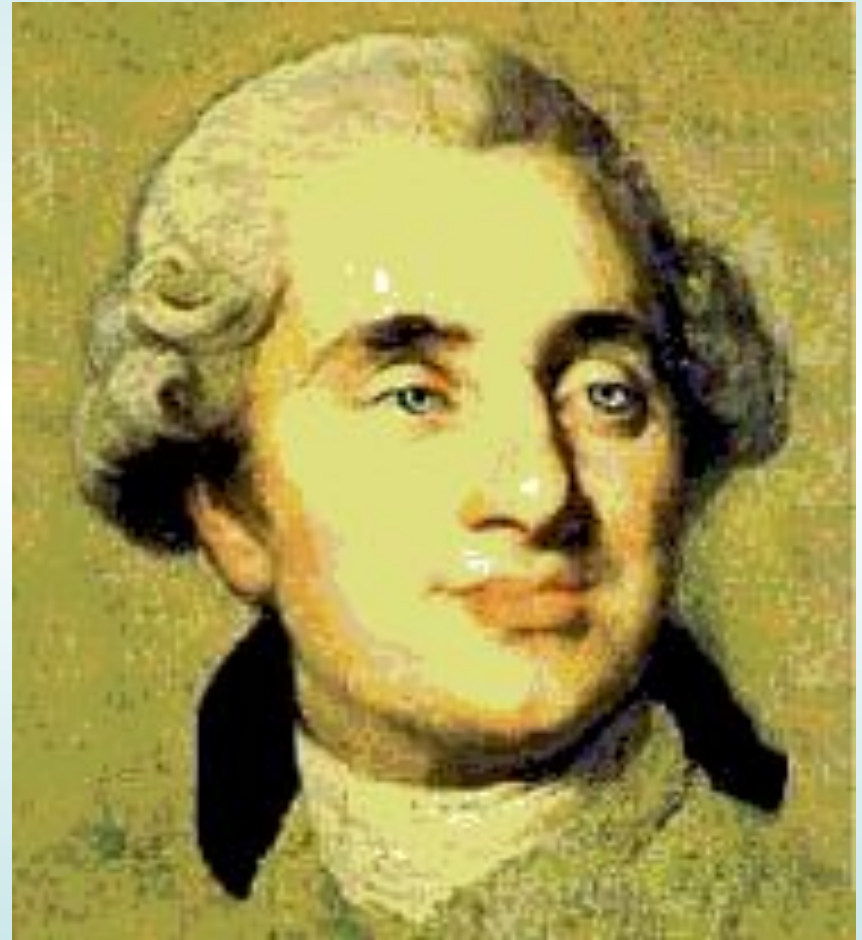
Людовик XVI Бурбон

принятие «Декларации прав человека и гражданина».