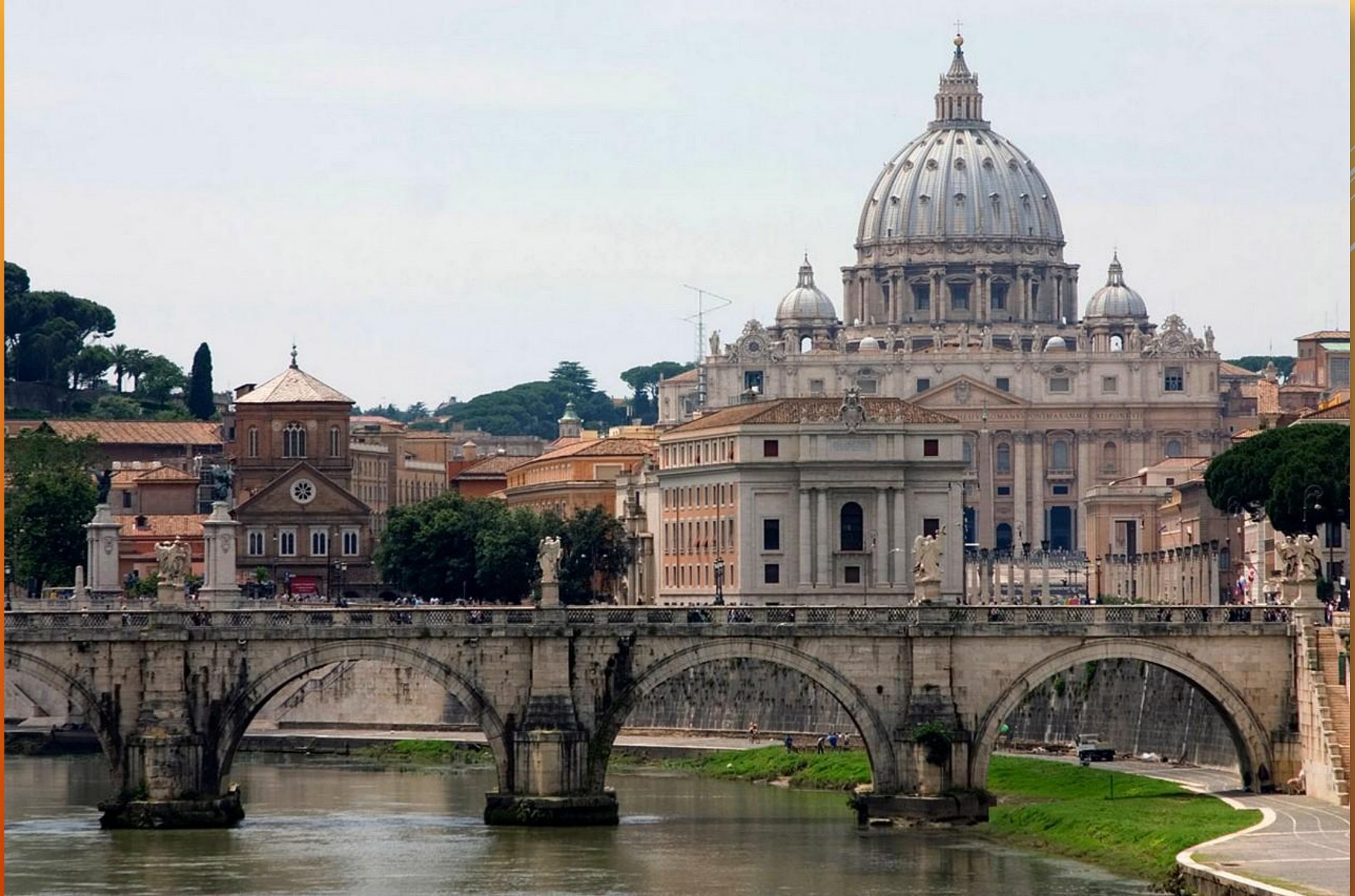
Базилика Святого Петра