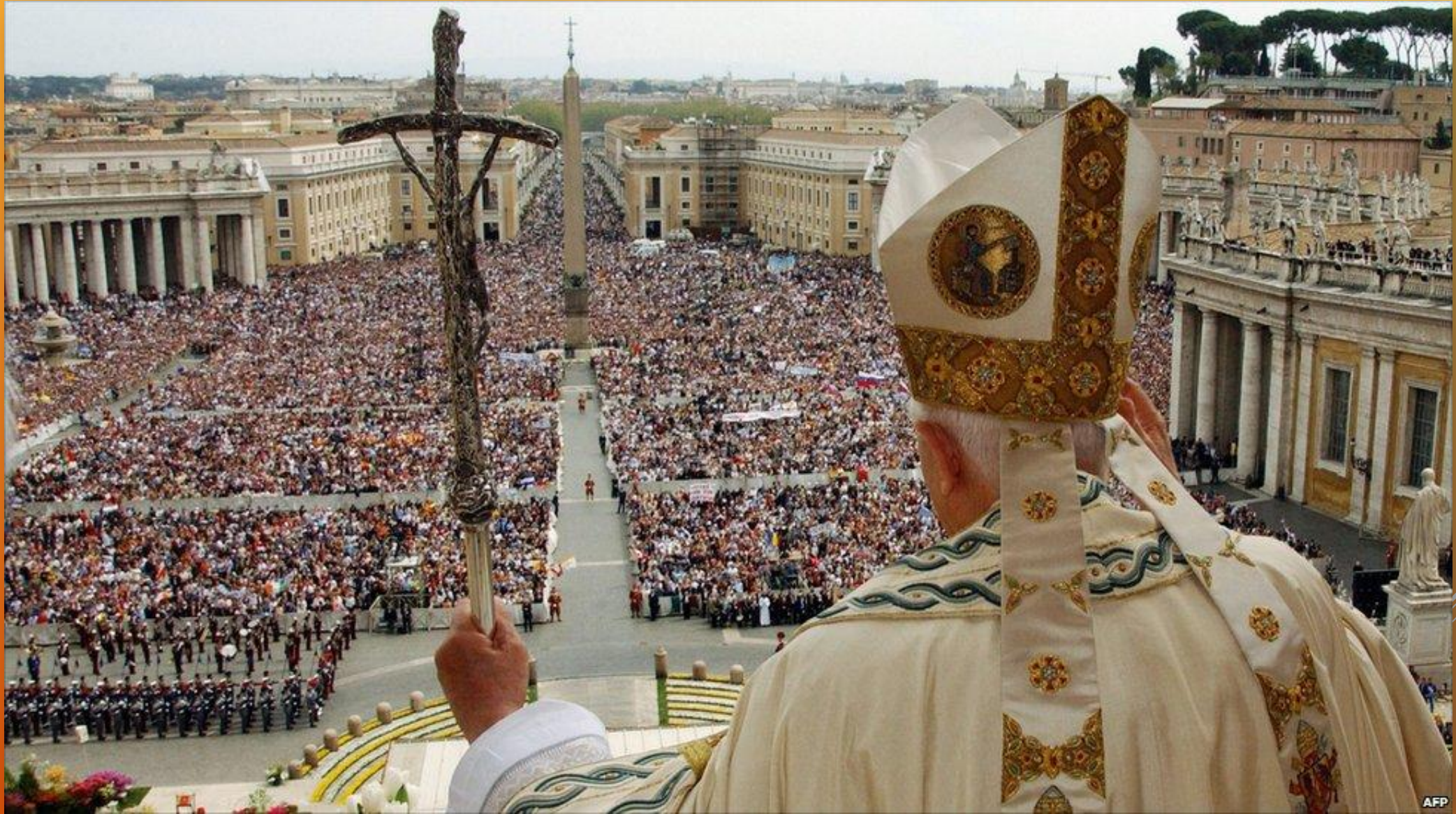
Франциск – Папа Римский (13.03.2013)