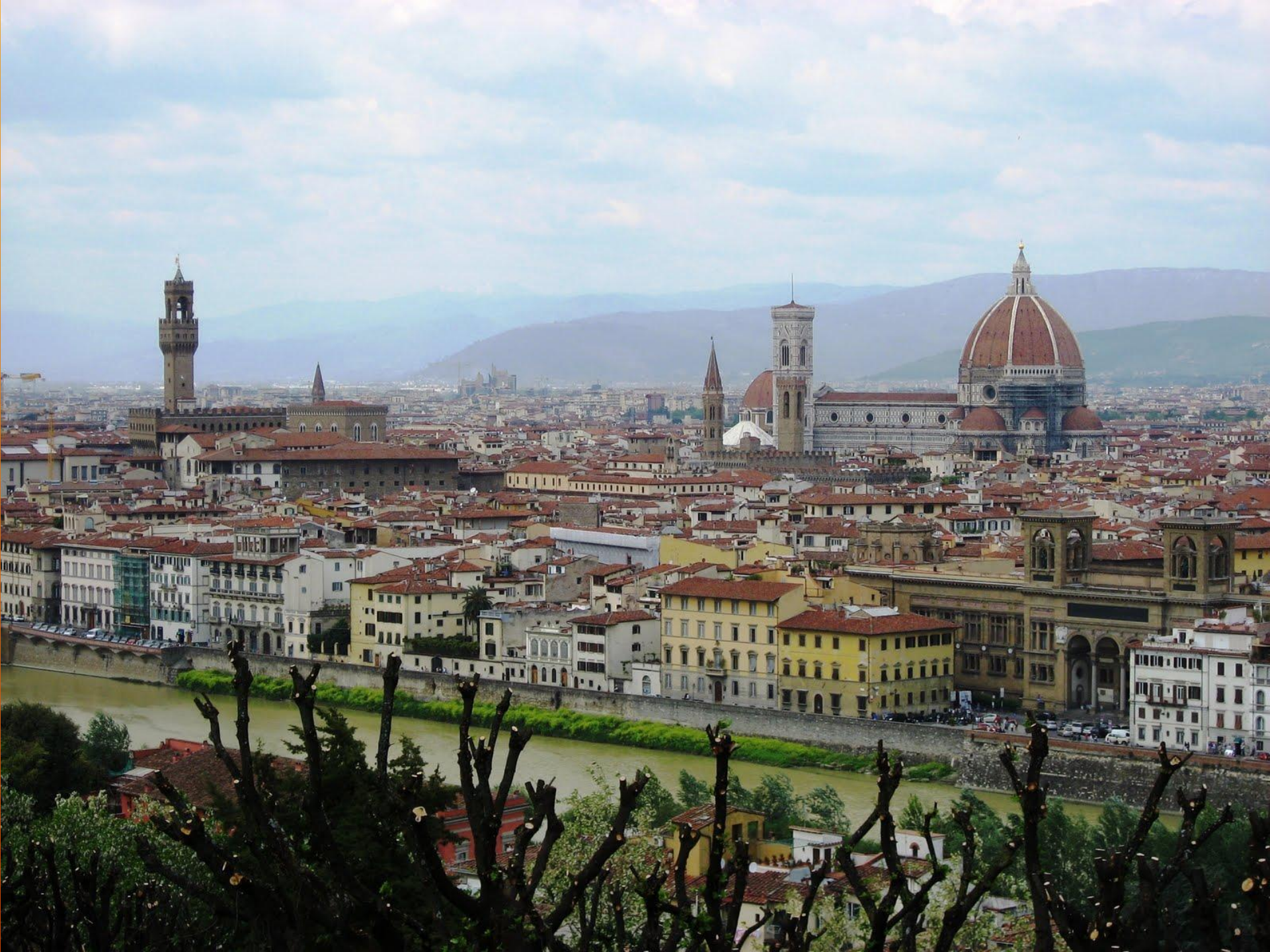
Флоренция Вид с площадки Микеланд жело