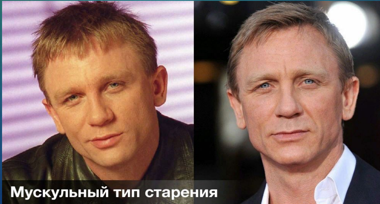
Мышечный тип старения