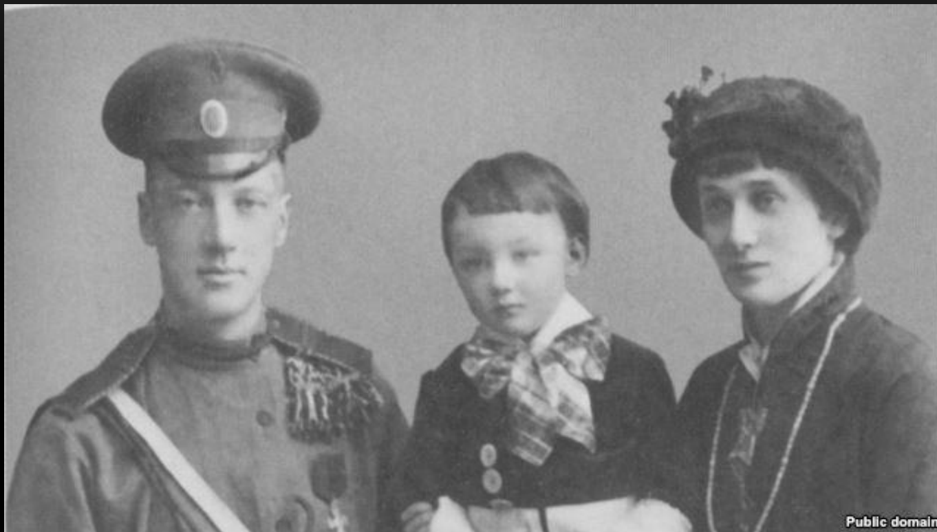
Николай Гумилев и Анна Ахматова с сыном Львом, 1915