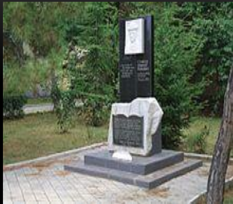
Памятник Николаю Гумилёву в Коктебеле