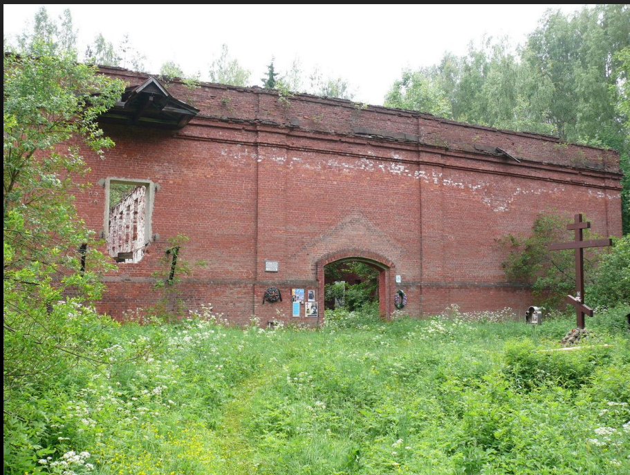
Крест-кенотаф в вероятном месте расстрела Гумилёва. Ковалевский лес