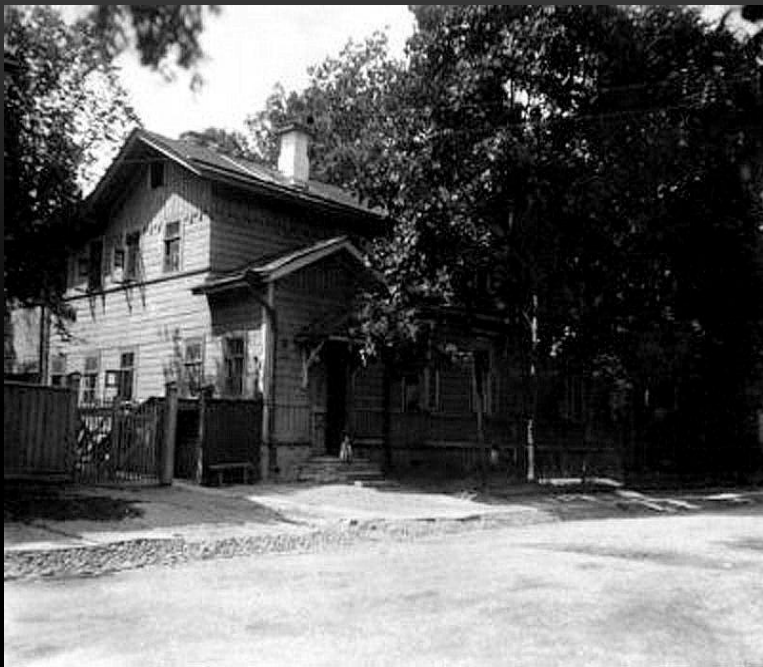
Дом Гумилева в Царском Селе