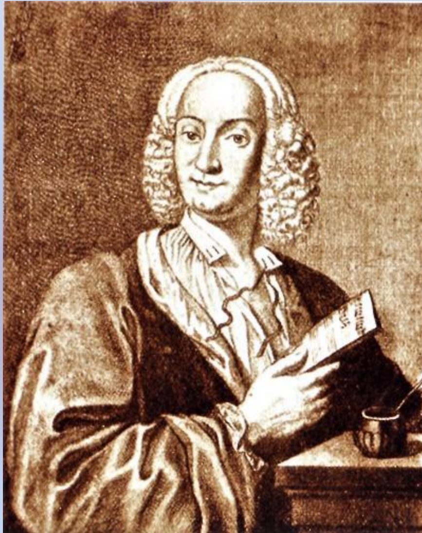
Гравюра де ла Каве, 1723г.