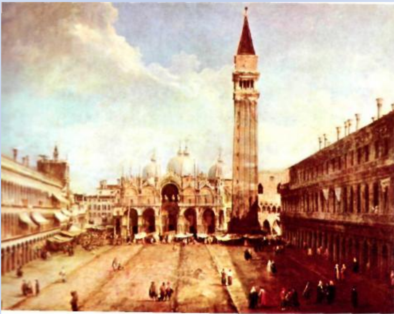
Венеция. Площадь Св. Марка. Каналетто, около 1723 г.