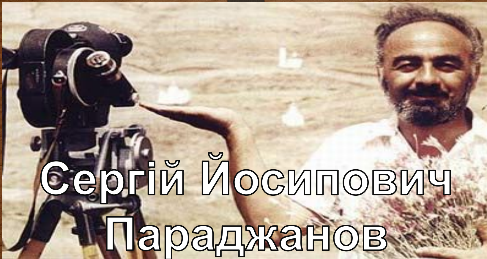
Сергій Йосипович Параджанов