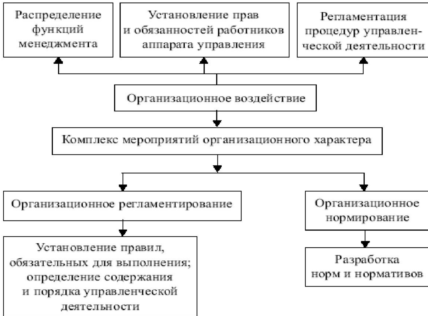
РИС. ХАРАКТЕРИСТИКА ОРГАНИЗАЦИОННОГО