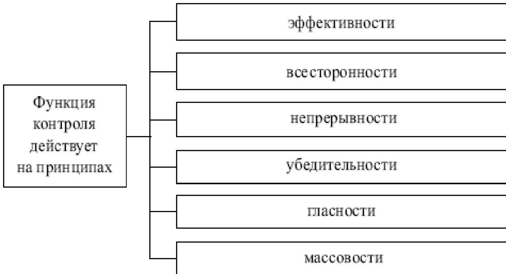
Рис. Принципы функции контроля