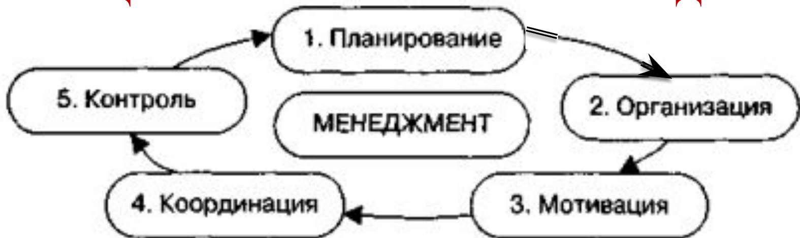
Рис. 1.5. Общие функции менеджмента