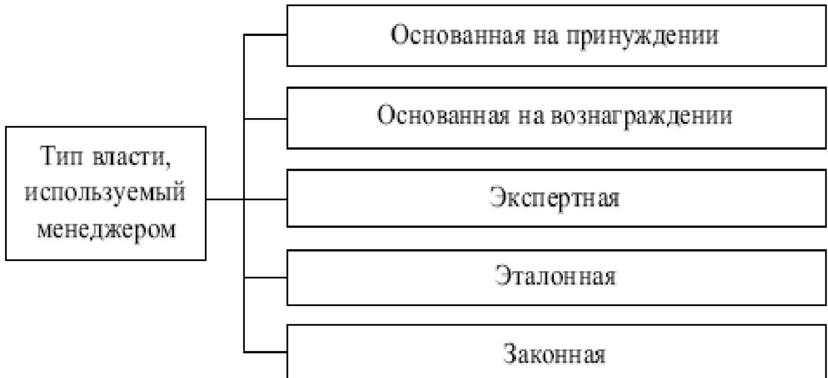
Рис. Типы власти

Руководство – управленческая деятельность, обеспечивающая нормальное протекание производственных и управленческих процессов.