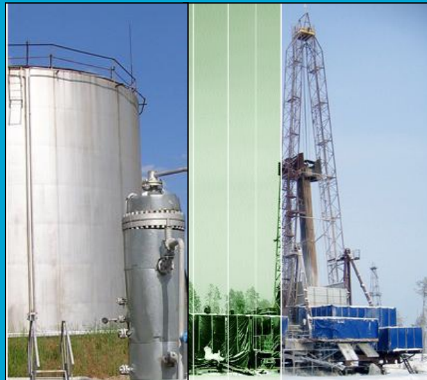
2008 и 2009 гг.