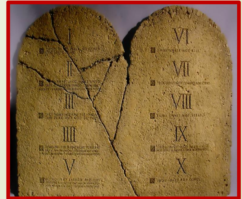
10 заповедей (закон Моисеев)

□ Филон считал, что излагаемое его философией учение содержится в Ветхом Завете. Для доказательства этого, он дает натянутые толкования словам священных книг. По мнению Филона, слова священного писания имеют, кроме простого, буквального смысла, другой, высший, аллегорический. Он давал аллегорические объяснения и заповедям закона Моисеева, оставляя, впрочем, за ними силу повелений божиих. Его учение имело большое влияние на христианских гностиков.