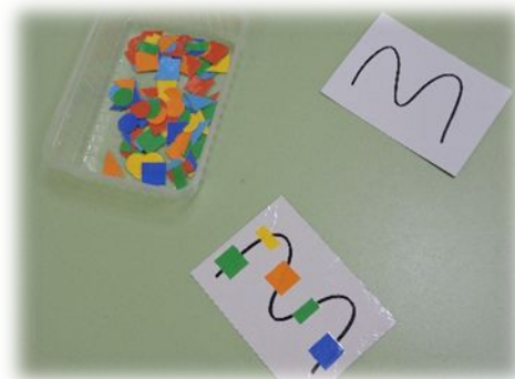
Игра «Собери бусы»