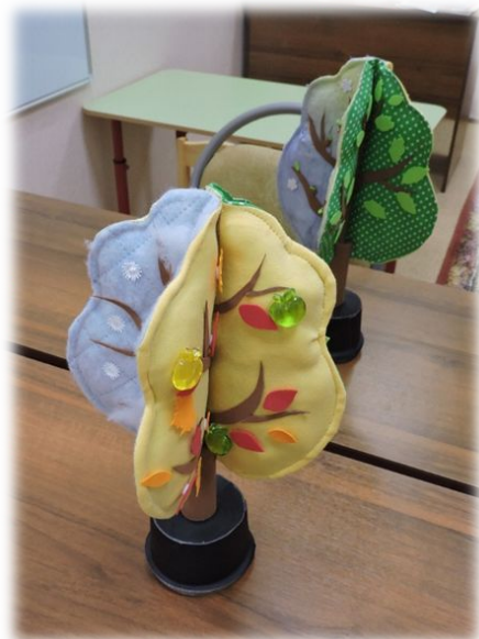
Дерево «Времена года»

Еще одним направлением работы учителя- дефектолога, является создание пособий для работы с детьми, которые носят как обучающий так и развивающий характер, и конечно же незаменимым помощником в работе.