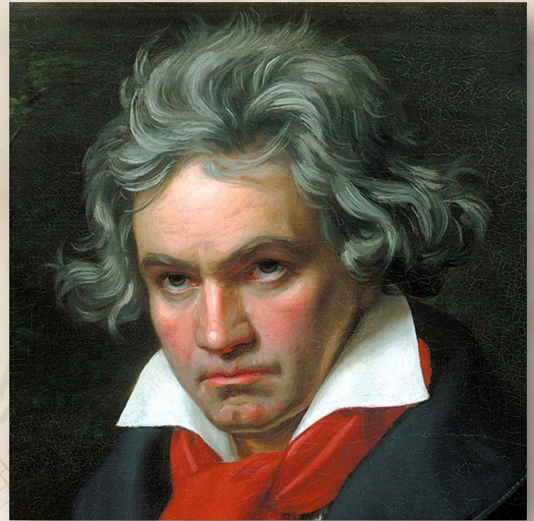
Людвиг ван Бетховен 1770-1827

Таким образом, композитор задает определенную программу образов.