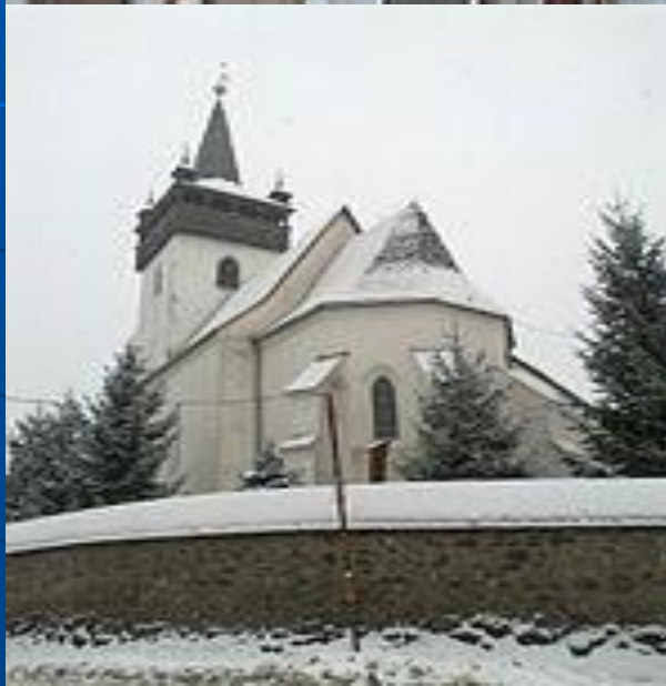
• Церква Святої Єлизавети в Хусті Церква Святої Єлизавети в Хусті на Закарпатті - одна з найхарактерніших пам'яток готики на українських теренах, нині Хустська Реформатська церква