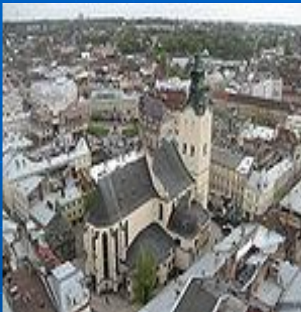
• Львівський кафедральний костел

Об'ємну композицію костелу витворено завдяки двом головним складовим: пресбітеріуму (вівтарній частині) та корпусу нав (власне молитовній залі).