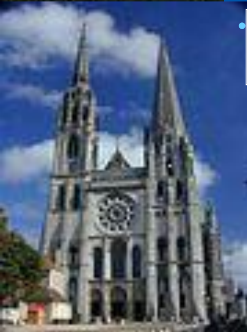
• Собор в Шартрі, Франція

В багатьох містах на базі церковних та приходських шкіл виникали університети, як нові форми культурно-просвітницьких установ. Вони сприяли розвитку освіченості та поступово змінювали мислення середньовічної людини. Посилюється дух раціоналізму, дух допитливості, встановлюється тенденція до дослідження нового. Зростала індивідуалізація світовідчуття кожної особистості. Поступово університети перетворилися на своєрідні інтелектуальні центри. На зміну романському мистецтву прийшла готика. Синонімом варварства назвали історики Відродження середньовічне мистецтво. На відміну від романського, готичне мистецтво «пропагує» інтерес до людських почуттів, звертається до краси реального світу, повертається до індивідуальності. Готичне мистецтво є символом квітучих торговельних і ремісничих міст-комун, що домоглися популярності й самостійності усередині феодального світу. Грандіозні готичні собори вирізнялися висотою, місткістю, ошатністю, видовищним і багатим декором. Для готичного стилю характерні гострі споруди, зі стрілчастими склепіннями, безліч кам'яного різьблення і скульптурних прикрас.