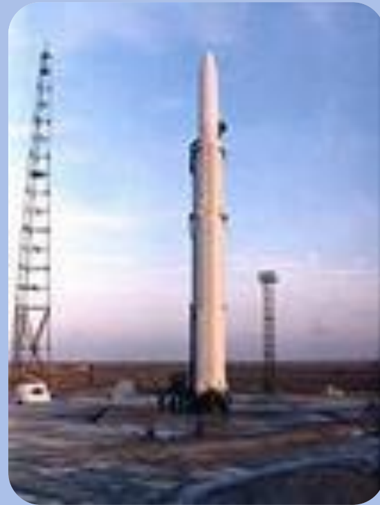
Ракета- носій “ Космос”