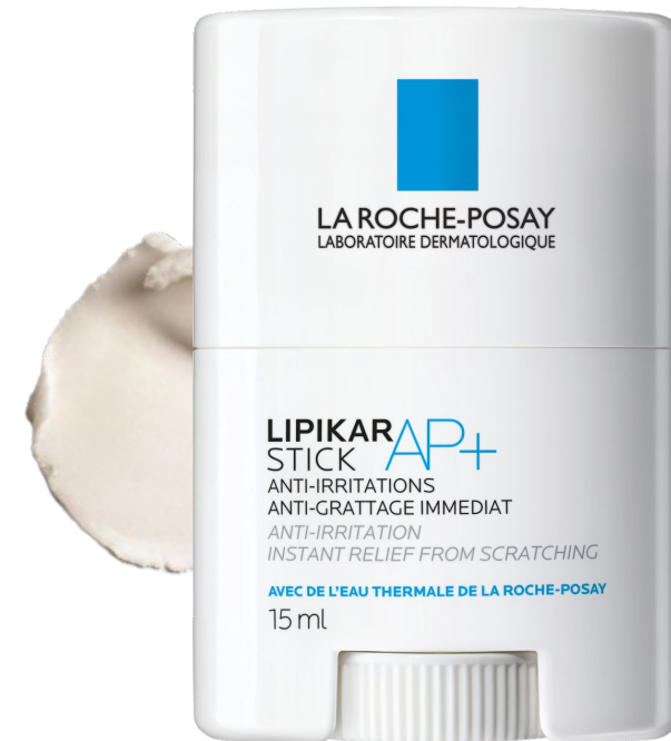
Ліпікар Стік АП+ Заспокоюючий відновлюючий засіб