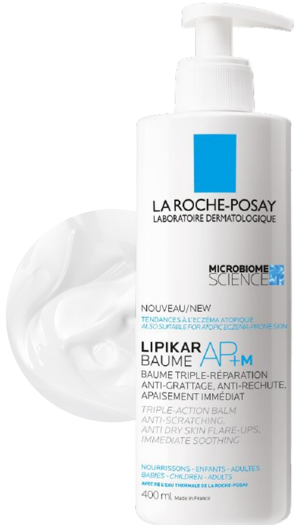
Ліпікар Бальзам АП+М Ліпідовідновлюючий бальзам