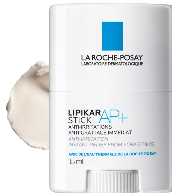
Липикар Стик АП+ Успокаивающее восстанавливающее средство