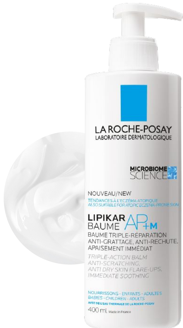
Липикар Бальзам АП+М Липидовосстанавливающий бальзам