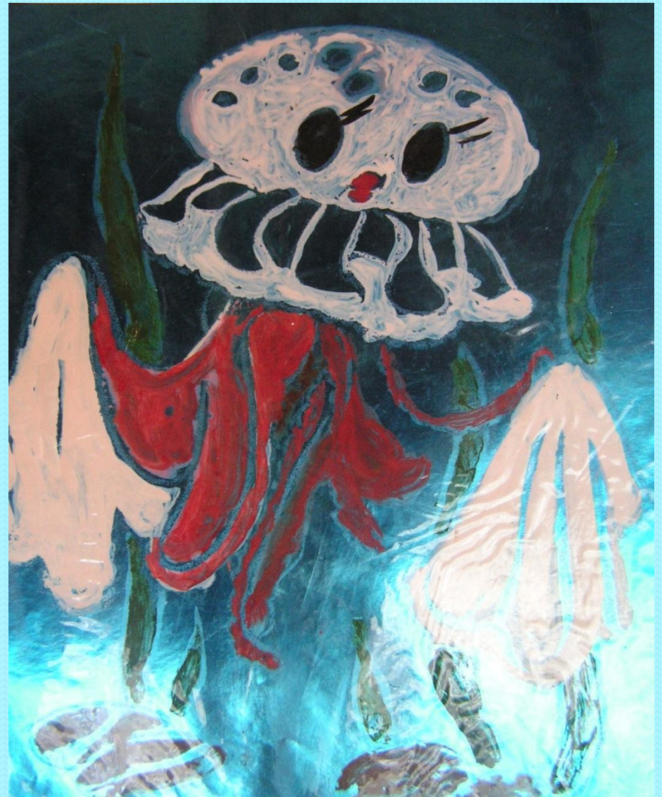
Рисунок наносится гуашью с добавлением клея ПВА. Цвет фольги подбираем по замыслу: голубую, синюю, фиолетовую, зеленую и т.д. Для изображения подводного животного, необходимо сделать рисунок, а потом “передавить” его на фольгу и разукрасить