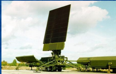
РЛС «Противник – Г»