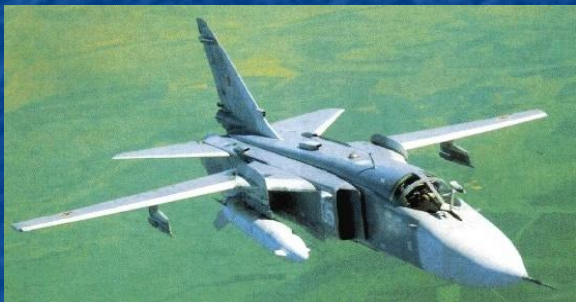
Фронтовой бомбардировщик Су-24М