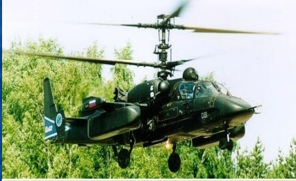
Боевой ударный вертолет Ка-52