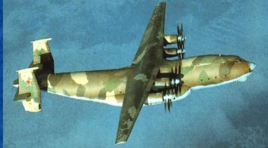
Транспортный самолет Ан-22