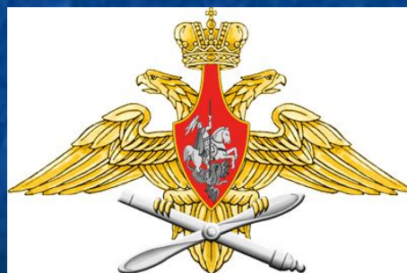
Средняя эмблема ВВС РФ