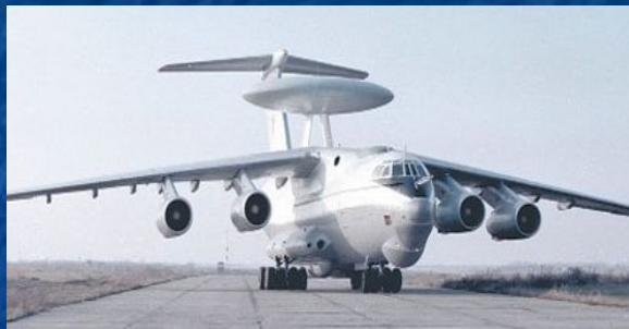
Самолет ДРЛОУ А-50