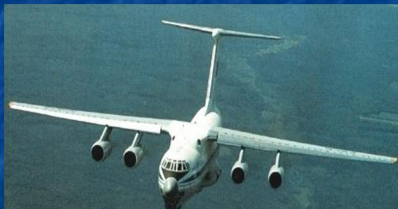
Авиационный топливозаправщик Ил-78Т