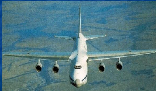
Военно- транспортный самолет Ан-124

Военно-транспортная авиация является средством Верховного Главнокомандующего Вооруженными Силами и обеспечивает перевозку по воздуху своих войск, боевой техники и грузов, а также выброску воздушных десантов.