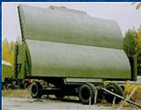
РЛС «Гамма – ДЕ»

РТВ предназначены для ведения радиолокационной разведки воздушного пространства противника, выдачи информации для радиолокационного обеспечения частей зенитных ракетных войск и авиации, а также для контроля воздушного пространства страны. Они оснащены различными типами РЛС .