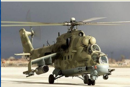
Боевой ударный вертолет Ми-24

Армейская авиация предназначена для авиационной поддержки Сухопутных войск путем поражения наземных, главным образом малоразмерных, бронированных подвижных объектов противника преимущественно на переднем крае и в тактической глубине, а также для решения задач всестороннего обеспечения общевойскового боя и повышения мобильности войск. При этом части и подразделения армейской авиации выполняют огневые, десантно-транспортные, разведывательные и специальные боевые задачи.