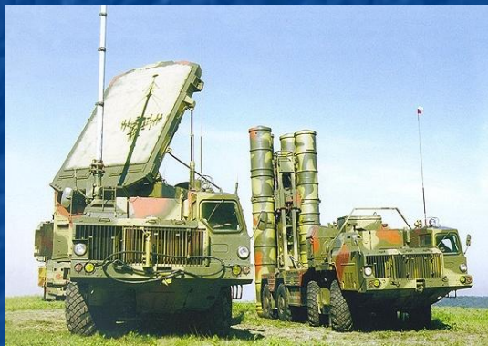
Зенитная ракетная система «С300 – ПМ»

Зенитные ракетные войска (ЗРВ) предназначены для прикрытия от воздушного нападения важных административно-политических промышленно-экономических и военных объектов и иных объектов страны. На вооружении ЗРВ находятся уникальные, превосходящие лучшие зарубежные аналоги зенитные ракетные системы (ЗРС) С-300ПМ, которые обладают высокими возможностями поражения всех современных средств воздушного нападения, во всем диапазоне высот и скоростей полета, в условиях радиопомех.