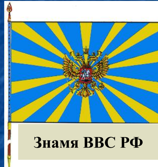
Знамя ВВС РФ