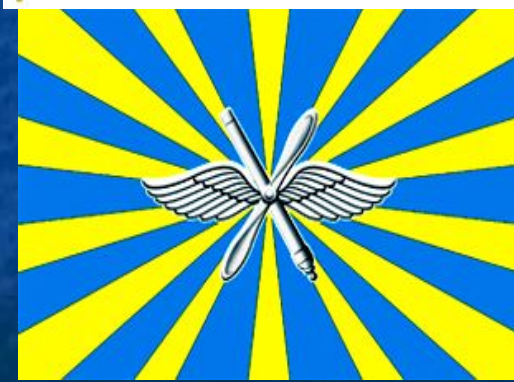
Флаг ВВС РФ