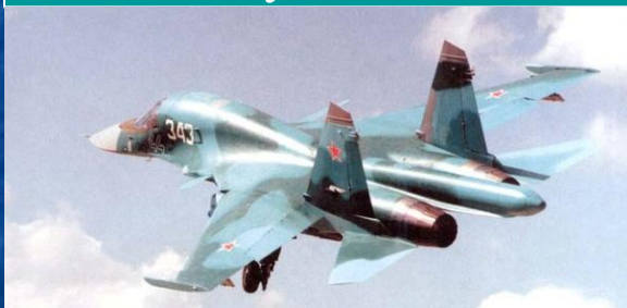
Фронтовой бомбардировщик Су-34

Фронтовая авиация – основная ударная сила ВВС, решает задачи в общевойсковых, совместных и самостоятельных операциях, предназначена для поражения войск, объектов противника в оперативной глубине в воздухе, на земле и на море. Может привлекаться для ведения воздушной разведки и минирования с воздуха.