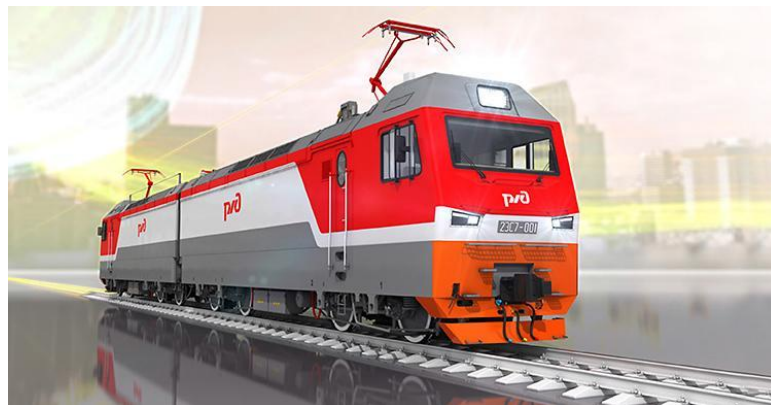
Грузовой электровоз 2ЭС7