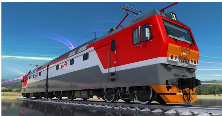
Грузовой электровоз 2ЭС6 «СИНАРА»