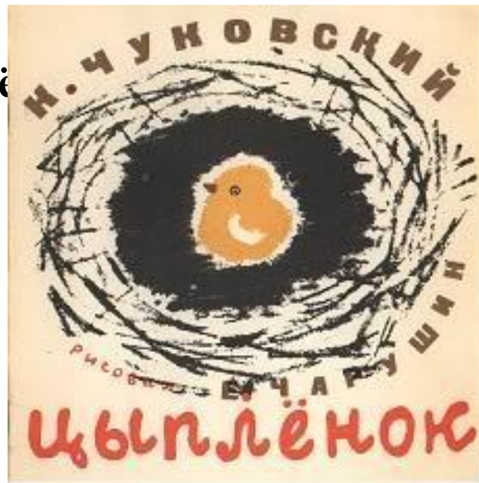
Первая сказка Чуковского «Цыплёнок», 1913

На протяжении всей своей жизни Чуковский общался с детьми, интересовался тем, о чём они говорят, думают, переживают, писал для них стихи и прозу.