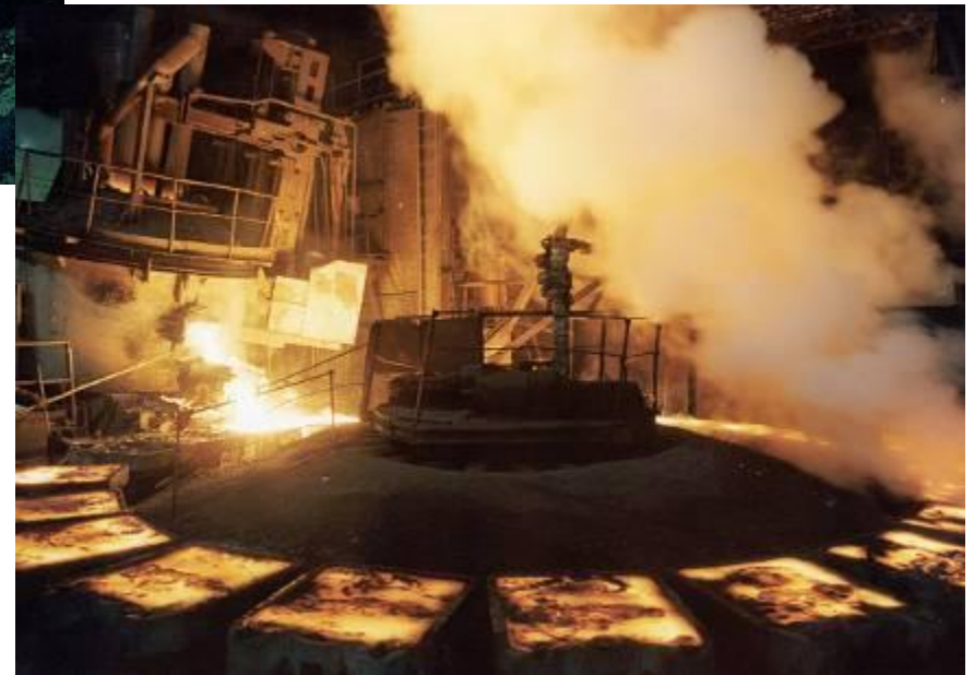
Никелевый завод. Разлив никелевых анодов.