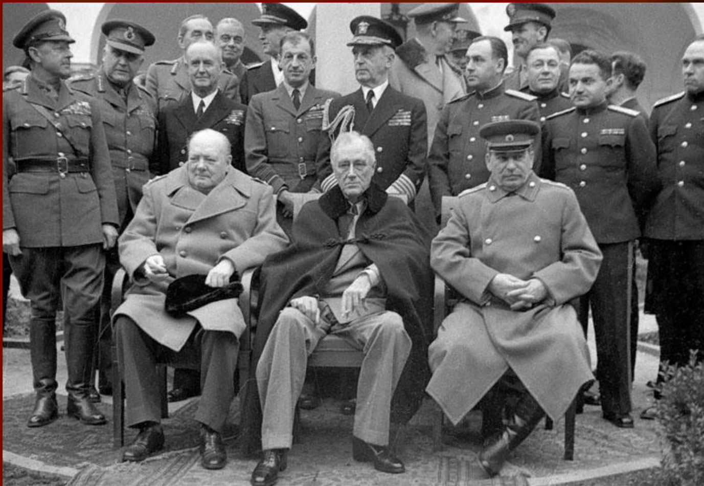
У. Черчилль, Ф.Д. Рузвельт, И.В. Сталин