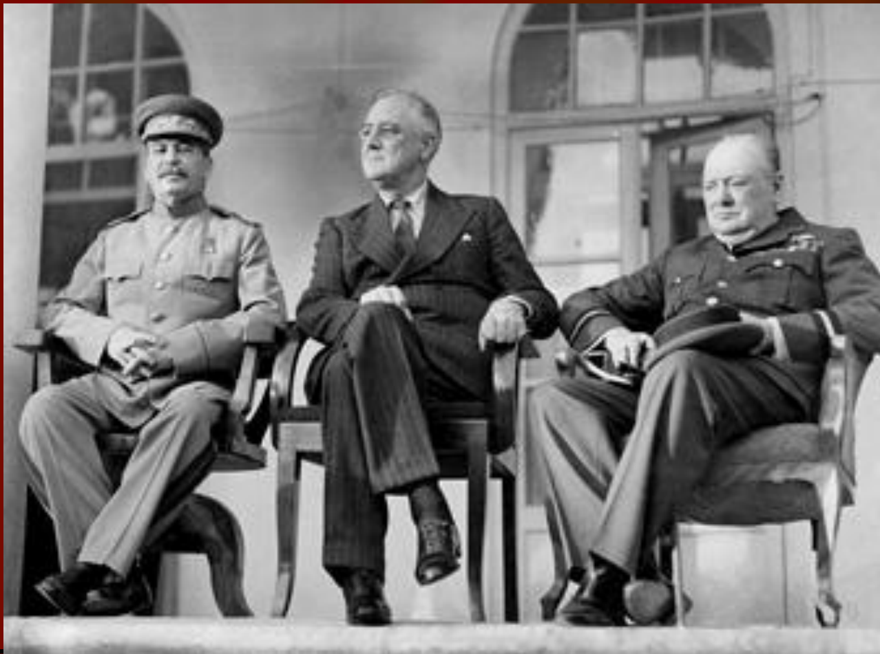
И.В. Сталин, Ф.Д. Рузвельт, У. Черчилль