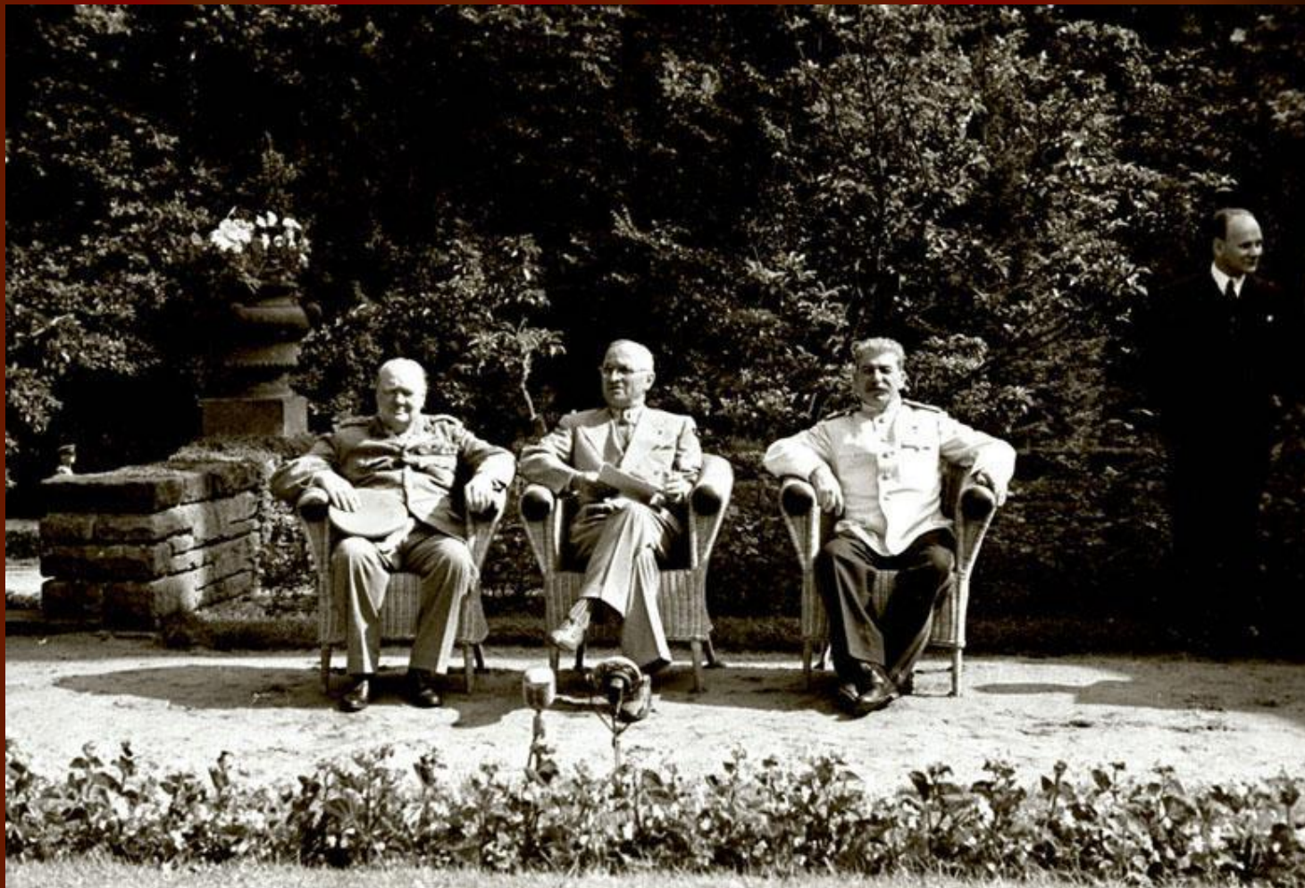
У. Черчилль, Г. Трумэн, И.В. Сталин