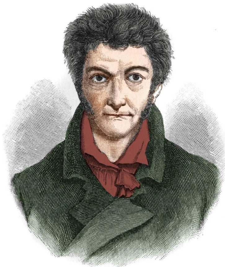
Эрнст Теодор Амадей Гофман 1776-1822

Так одного из Щелкунчиков увидел в начале XIX века замечательный немецкий сказочник Эрнст Теодор Амадей Гофман. И его фантазия создала великолепную сказку, героем которой стал Щелкунчик. Сказка «Щелкунчик и мышинный король» (нем. Nußknacker und Mausekönig) впервые была опубликована в 1816 г