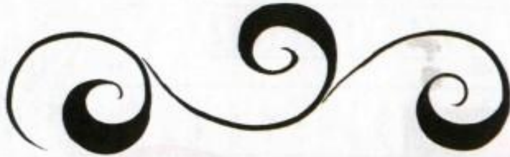
ВЕДУЩИЙ СТЕБЕЛЬ – «КРИУЛЬ»