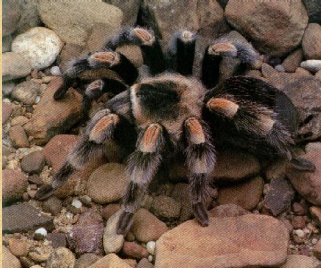
Мексиканский красноногий тарантул

Самые большие пауки принадлежат семейству волосатых пауков – тарантулов.