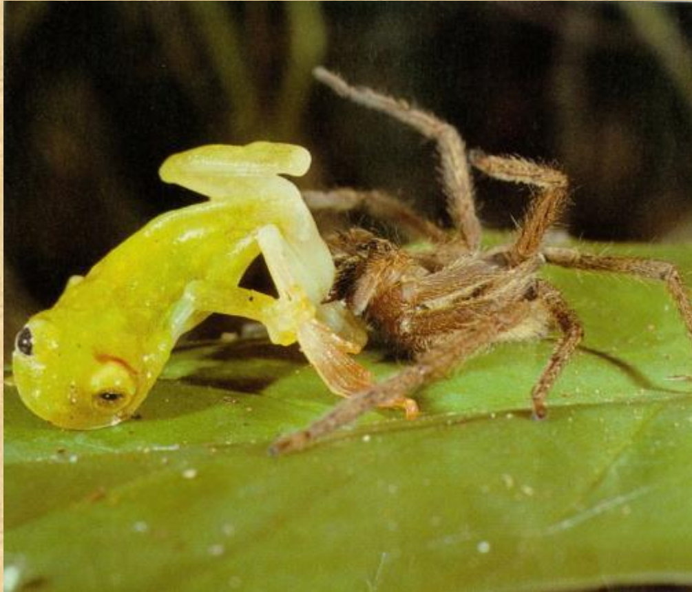
Паук, питающийся лягушками

Есть и большие пауки, которые едят птиц, мышей и лягушек.