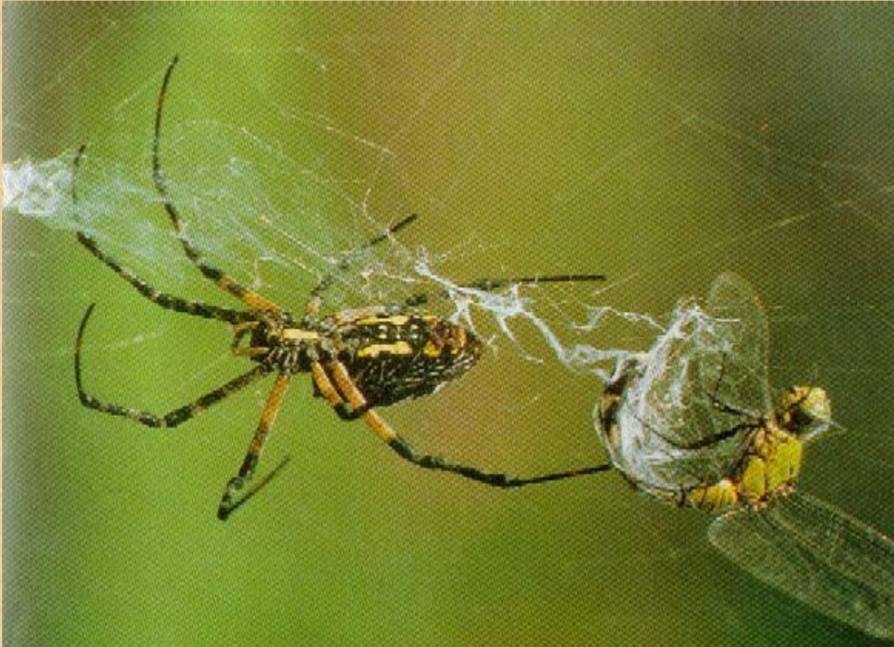
Садовый паук и стрекоза

Потом приходит паук, впрыскивает яд и поедает жертву.