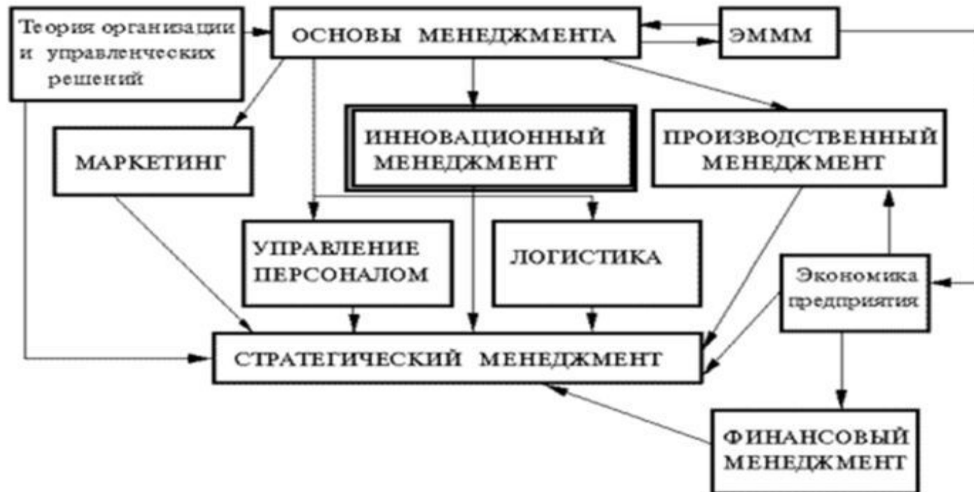
Рис. 1. Место дисциплины "Инновационный менеджмент" в цикле дисциплин по теории и практике управления