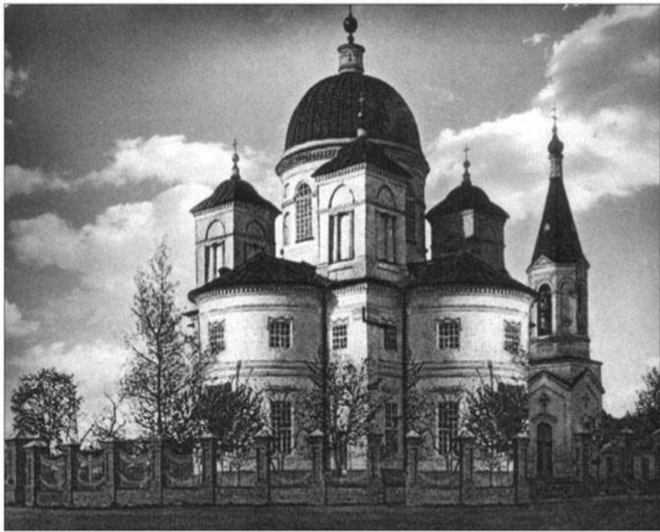
Лохвиця. Різдвяно-Богородицька церква. Поч. 1900-х.

Калнишевський власним коштом спорудив і відремонтував багато православних храмів.