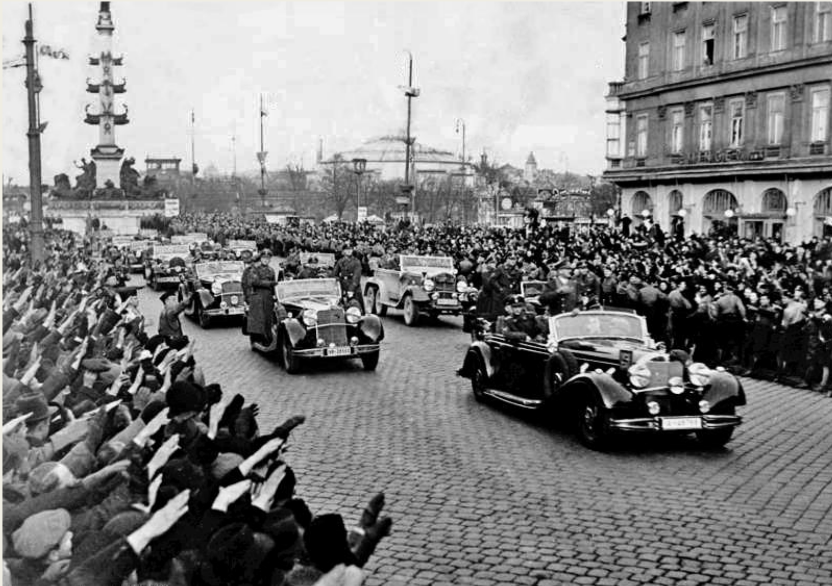
Жители Вены приветствуют А. Гитлера