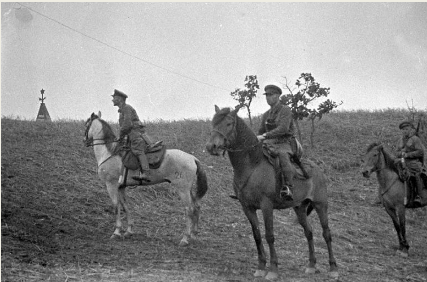
Советские пограничники у озера Хасан