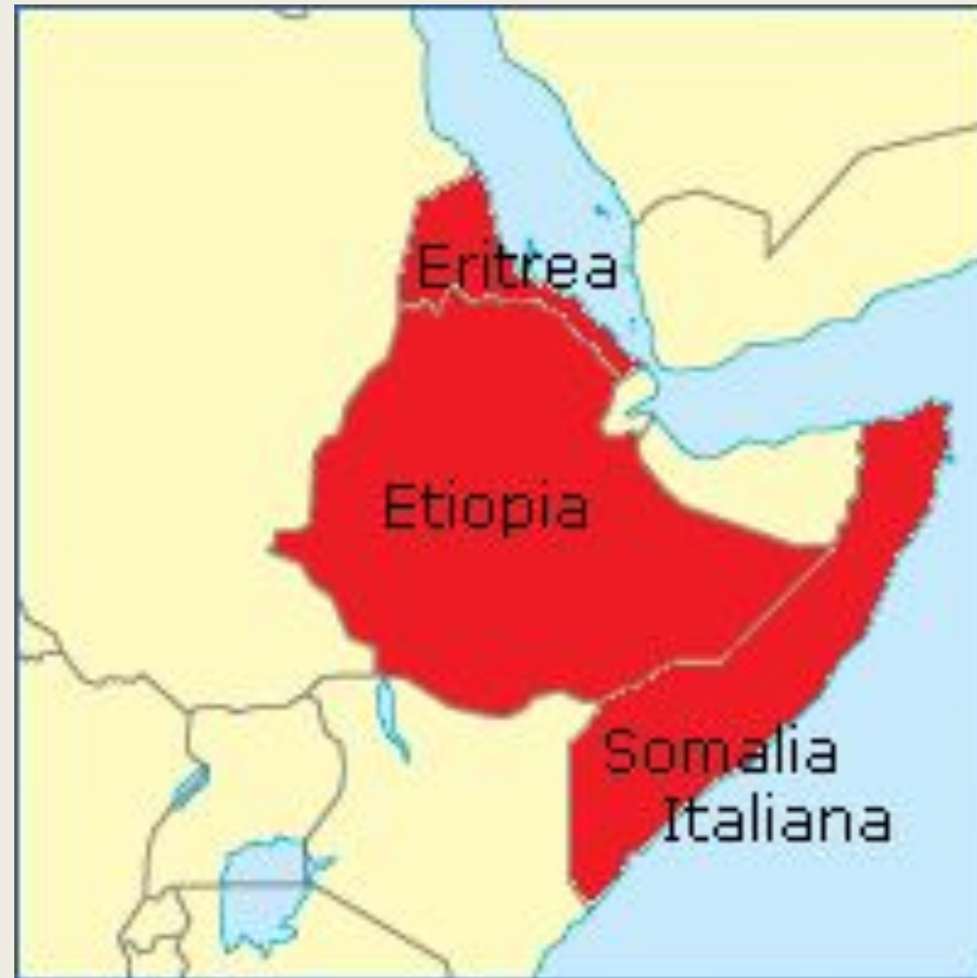
Итальянская Восточная Африка