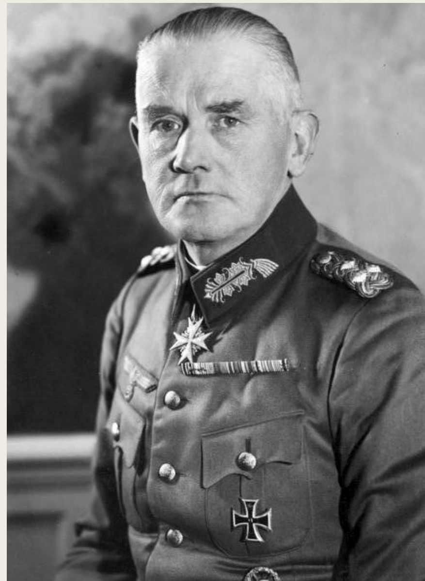
Вернер фон Бломберг – главнокомандующий и военный министр до 1938 г.