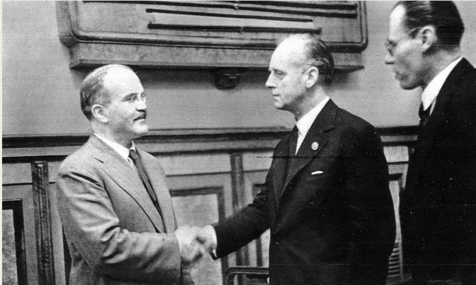
В.М. Молотов и И. фон Риббентроп на подписании пакта о ненападении