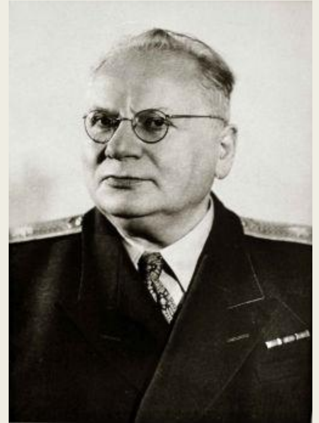
М.М. Литвинов – нарком иностранных дел в 1930-1939 гг.