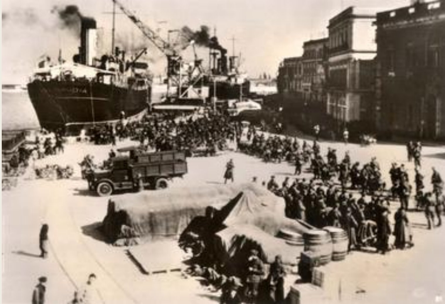
Высадка итальянских войск в Албании