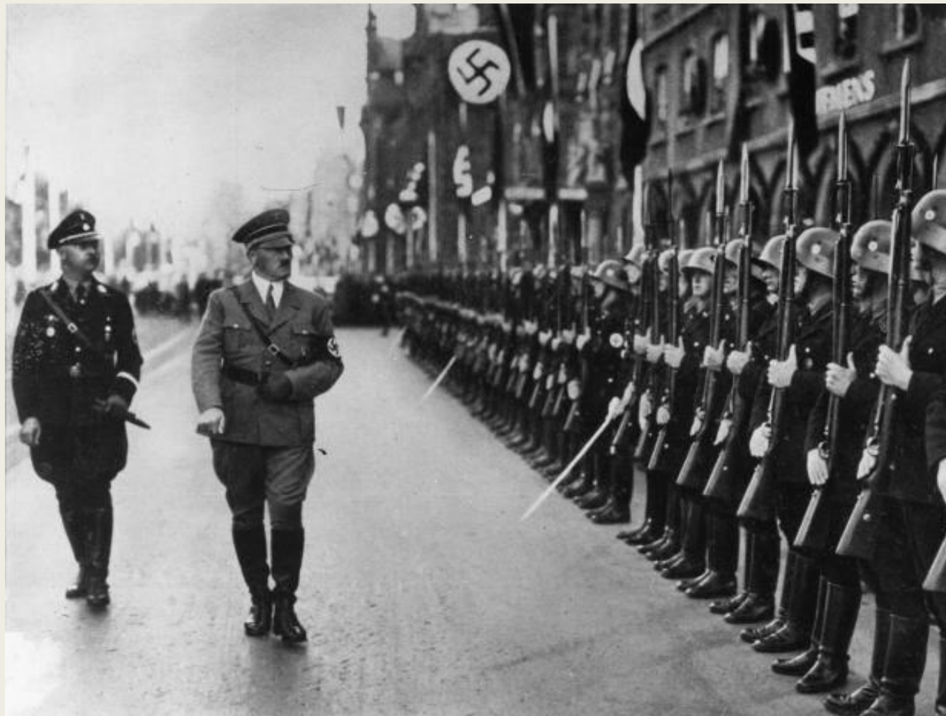
А. Гитлер и Г. Гиммлер проводят смотр частей СС

Политика умиротворения – уступки мировых держав требованиям Германии в надежде избежать войны