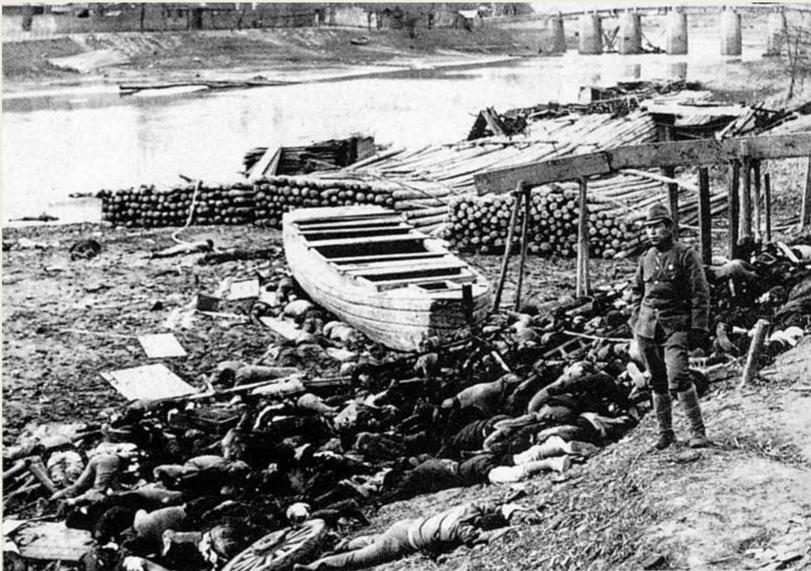
Декабрь 1937 г. – Нанкинская резня