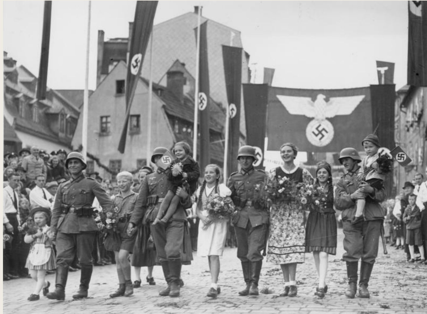
Немцы Судетской области приветствуют солдат Вермахта