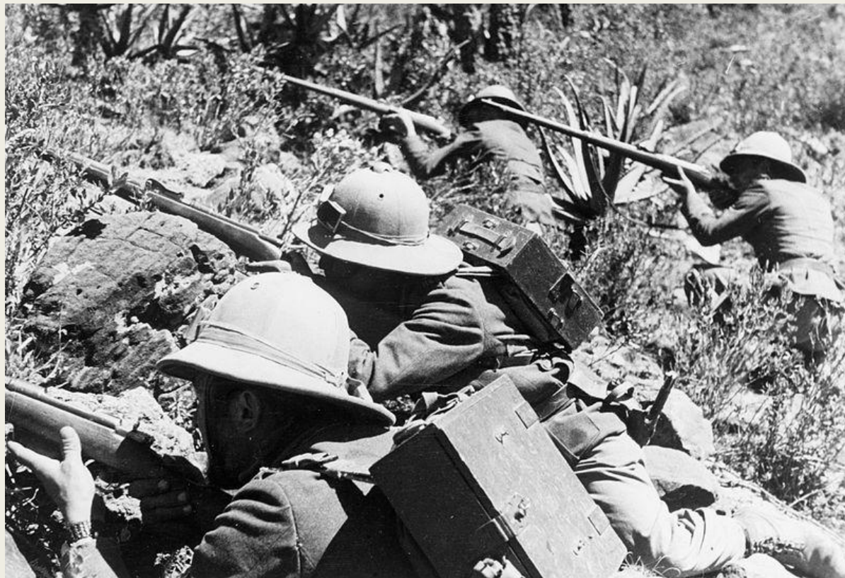
Итальянские войска в Эфиопии