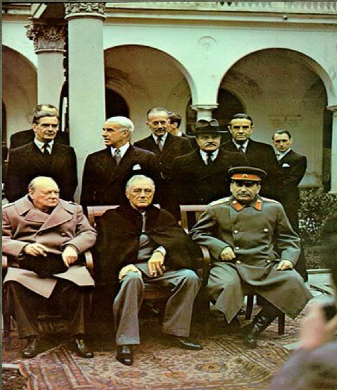
На Крымской (Ялтинской) Конференции 1945 г. лидеры стран- победительниц: Ф. Рузвельт, У. Черчилль, И.В. Сталин.