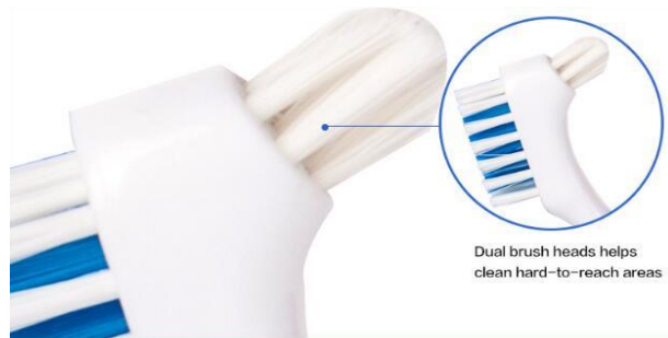
Dual brush heads helps clean hard-to-reach areas

Производитель: Anhui Greenland Biotech Co., LTD, Китай