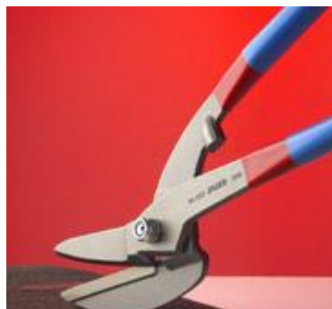
для резки листового металла