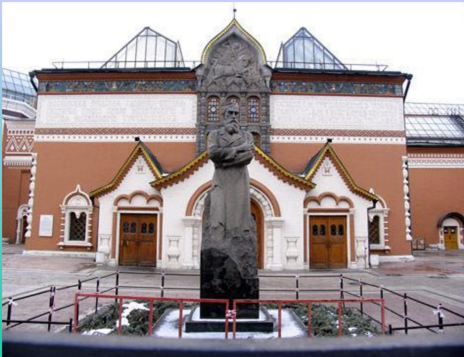
Третьяковская галерея – музей русского изобразительного искусства