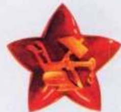
Красноармей- ская звезда