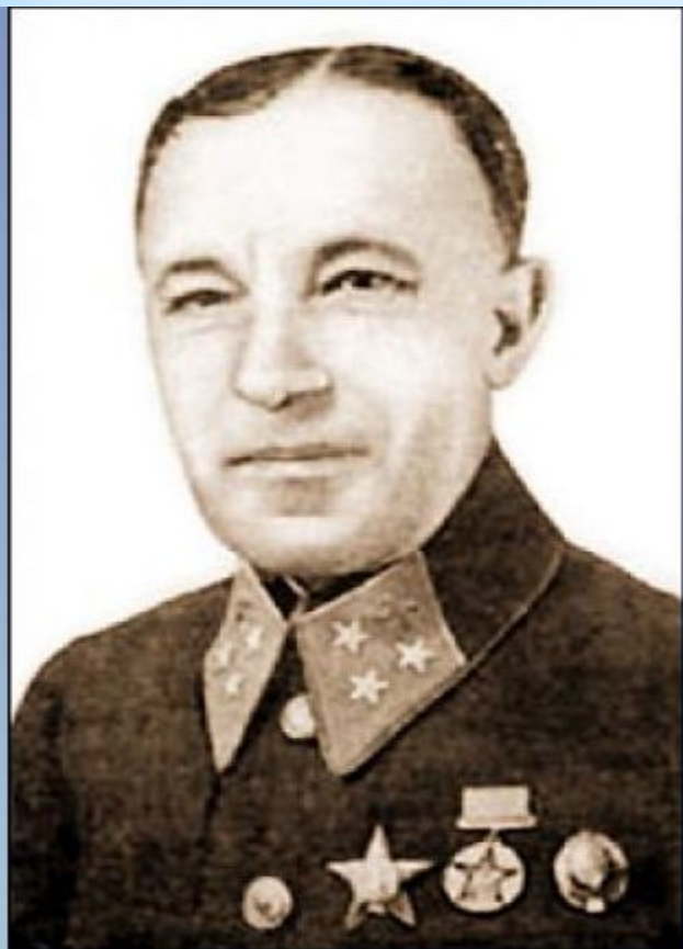
Дмитрий Михайлович Карбышев. Герой Советского Союза