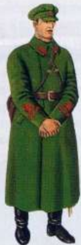
Красная Армия. Командир батальона. 1920 г.