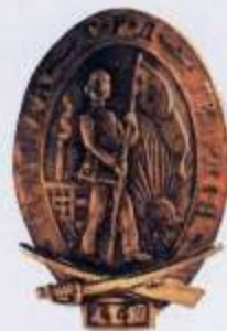
Знак Красной Гвардии. Петроград. Май 1917 г.