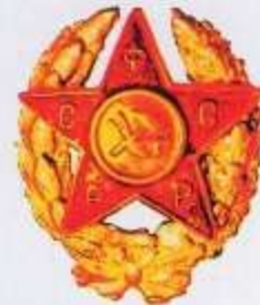
Знак командира РККА