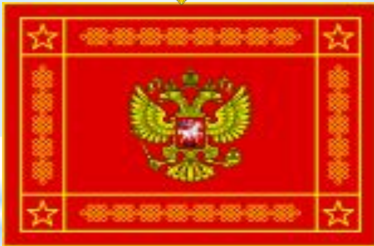
Эмблема и Знамя Вооружённых сил России Размеры оригинала 170 см × 130 см