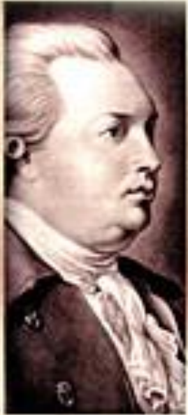
Д. И. Фонвизин Комедии

Автор негодует на порок И клеймит его без пощады.