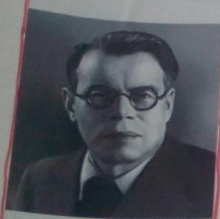
Михаил Васильевич Исаковский Композитор.

Песенной девушкой с нежным именем Катюша, верной и любимой подруги бойца-пограничника, был близок. Слова и музыка «Катюши» вызывают светлые чувства уверенности и надежды. И за это песню полюбили и безоговорочно приняли всюду и все!