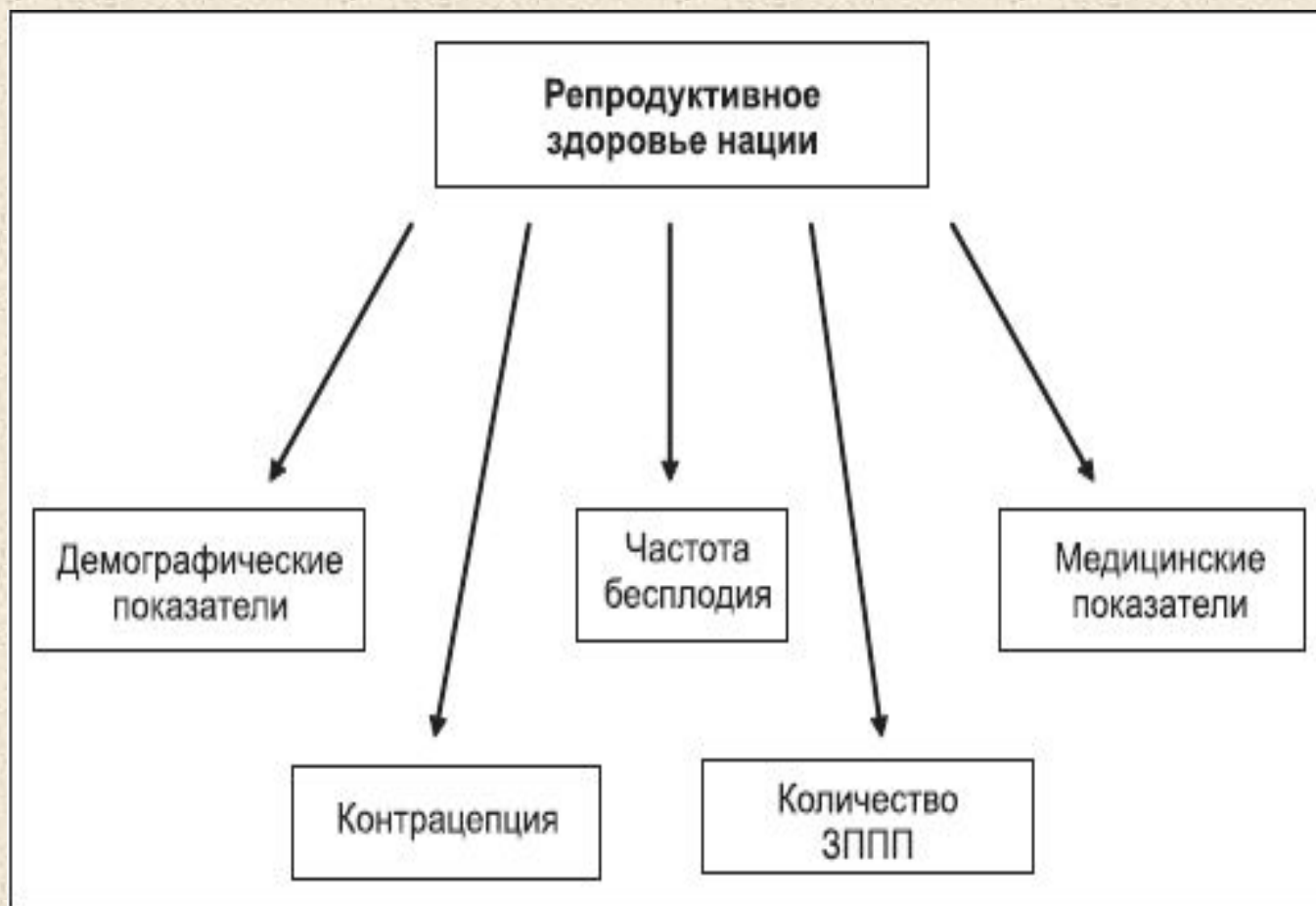
Рисунок 1. Показатели репродуктивного здоровья